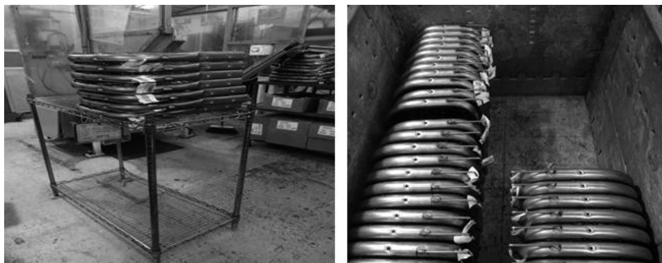
Figura 2. Muestra de partes de bastidores saliendo del proceso de soldadura, para manufacturar el asiento de un automóvil.

Para garantizar el cumplimiento con los requisitos de calidad, los productos son sometidos a pruebas tanto destructivas como no destructivas. Dentro de las primeras, se aplican aquellas de tensión a las soldaduras de dichos bastidores, y que los destruyen por su naturaleza, lo que genera un material de desecho o scrap.