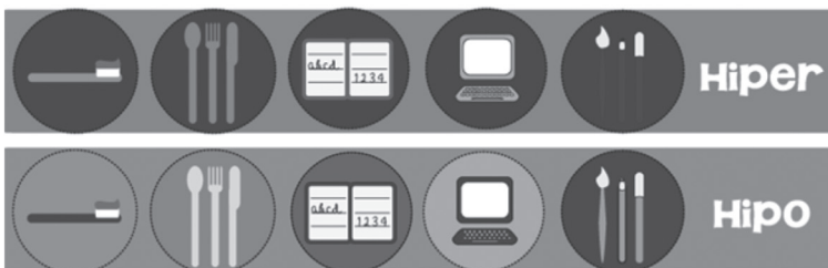
Figura 3. Exemplo padrões hiper-resposta e hipo-resposta visual

Incorporamos também os conceitos ligados aos tipos de respostas hipo e hiper, com maior enfoque no sistema sensorial visual. Para isso foram criados dois padrões cromáticos para o PVA, um que favorece a hipo-resposta e outro que favorece a hiper-resposta.