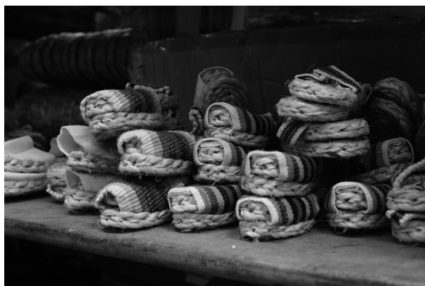
Figura 6. Producción artesanal de alpargatas, calzado tradicional en zonas rurales. Mercado de El Potrerillo. San Juan de Pasto, Colombia.

A partir de estas etapas se desarrolla finalmente el estudio folklórico, dando lugar a los distintos productos de investigación-creación, a través de los cuales, se lleva a cabo un abordaje de diversos fenómenos socioculturales y expresiones de carácter popular, tradicional y folklórico, que convergen dentro de estos escenarios de preservación cultural. La definición de muchas de las expresiones y prácticas que en estos lugares se desarrollan, se realiza con base en las denominaciones, condiciones y categorías propuestas por Abadía-Morales (1983), quien establece una serie de características, necesarias para definir una expresión o práctica como folklore , desglosando igualmente este concepto en una tipología o taxonomía, en la cual se establecen cuatro formas o campos de aplicación, incluyendo folklore literario, folklore musical, folklore coreográfico y folklore demosófico, siendo este último el de mayor relación con los mercados populares, abarcando herencia alimentaria y producción artesanal, de carácter decorativo y utilitario ( figuras 6, 7 y 8 ).