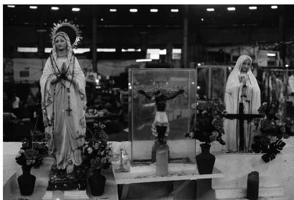
Figura 5. Altares e imagería del catolicismo. Plaza de mercado. Manizales, Colombia.

Como lo expone Calvache-Cabrera et al. (2022), la diversidad en cuanto a las variables y entornos, que determinan el proceso investigación y creación en el diseño y las artes, implica una amplia variedad en cuanto a los modelos o rutas metodológicas a seguir, descartando la idea de un método único para la concreción de los objetivos propuestos.