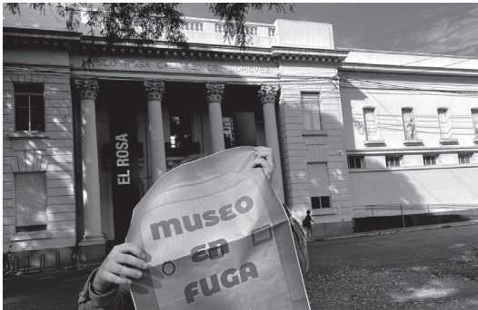
Figura 31. Fotografía de difusión del proyecto “Museo en fuga”.

El recorrido del museo-sistema desde 2016 hasta la actualidad es un marco de contención que posibilita la construcción de preguntas y de definiciones de la A, a la Z (Ver Figura 31).