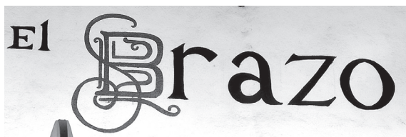
Figura 19. Vista frontal de El Brazo, en Erongaricuario, Michoacán.

Siguiendo con el recorrido por los portales de la plaza también se encuentra este otro rótulo (Ver Figura 19), en el cual se trató de seguir los mismos ornamentos que en la S y la A anterior, pero se nota que no tiene tanto garigoleos, solo se percibe la S y los pequeños ornamentos en los ojos de la B, así como un pequeño trazo a un lado de la asta y en la base. Las letras negras dejan de ser del mismo peso y separación.