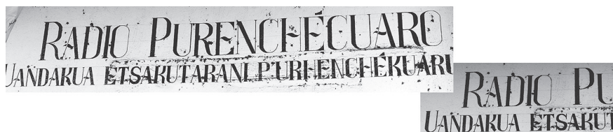
Figura 25. Vista frontal de Radio Purenchécuaro, San Jerónimo Purenchécuaro Michoacán.

San Jerónimo Purenchécuaro es un poblado que se encuentra a 19km de Erongaricuaru, aproximadamente a 27 minutos en automóvil; la plaza principal se encuentra rodeada de tres portales. En uno de los portales se muestra el rótulo de la Radio (Ver Figura 25), la cual muestra como se utiliza la tipografía Pátzcuaro pero de manera light, dejando de lado el grosor de la letra, además utiliza el color rojo en cada una de las capitulares de cada palabra.