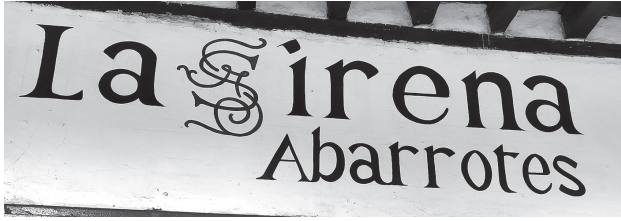
Figura 16. Vista frontal de La Sirena Abarrotes en Erogaricuario, Michoacán (Archivo personal, 2023).

En la tipografía negra se conservan los patines (serif) pero la fuente tipográfica no es la misma utilizada en Pátzcuaro, ni siquiera tiene rasgos de la fuente “Pátzcuaro” (Ver Figura 17). A pesar de que en su mayoría los establecimientos utilizan este estilo, también se perciben ciertas diferencias.