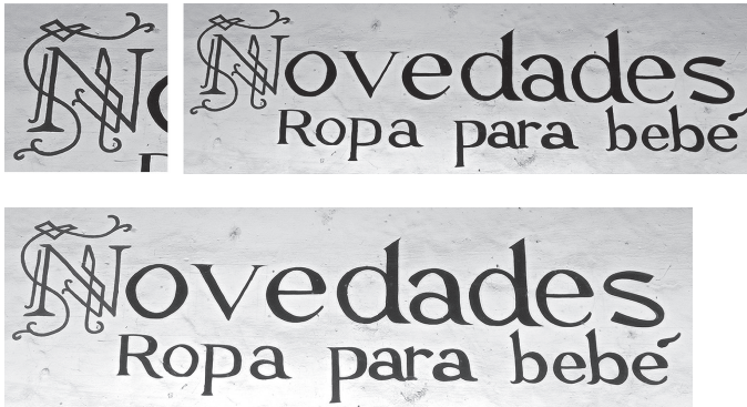
Figura 17. Detalle en capitular y vista frontal de Novedades, Ropa para bebé en Erogaricuario, Michoacán.

En la tipografía negra se conservan los patines (serif) pero la fuente tipográfica no es la misma utilizada en Pátzcuaro, ni siquiera tiene rasgos de la fuente “Pátzcuaro” (Ver Figura 17). A pesar de que en su mayoría los establecimientos utilizan este estilo, también se perciben ciertas diferencias.