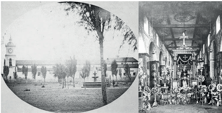
Figura 2. Ambato. Iglesia colonial de la Matriz ca. 1900. (Izq.) Fachada lateral hacia la plaza Mayor, actual parque Montalvo (AAH 2022); (Drcha.) Nave central (Skyscrapercity 2022).