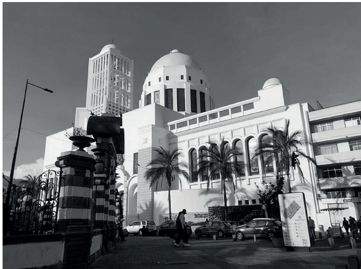
Figura 3. Ambato. Iglesia Catedral.

aprecian diferencias con la obra culminada, y también a través de unas líneas punteadas, la posibilidad de una variante para la ubicación de dos torres, aunque finalmente solo se alcanzó a realizar una; ya que de lo que se ve en una de las fotografías históricas, se dejó iniciadas las bases de la segunda torre sobre el pie de la nave lateral izquierda. Cevallos (1994, 86) indica que en 1920 Brüning realizó otros planos de fachada.