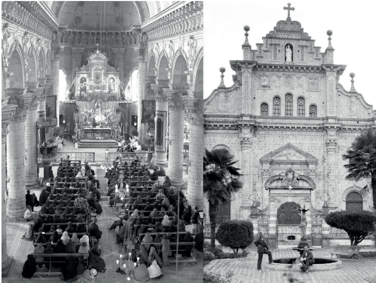
Figura 1. Ambato. Iglesia Matriz ca. 1933. (Izq.) Fachada frontal; (Dcha.) Nave central (Zapater dir. 2010).