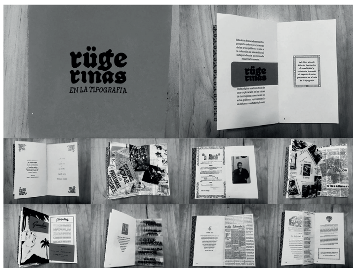
Figura 2. Primer prototipo Rugarinas en la tipografía