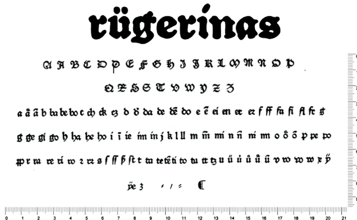
Figura 1. Fuente gótica “1:120G”

“Rügerinas” es un proyecto editorial que tiene como objetivo crear un espacio dedicado a la visibilización de las artistas gráficas latinoamericanas. Este proyecto no solo presenta proyectos u obras significativas de las artistas, sino también comparte sus historias personales, ideas y perspectivas críticas. La publicación funciona como un archivo visual y biográfico, aspirando a exhibir de manera integral la trayectoria de cada artista. “Rügerinas” toma su nombre en homenaje a Anna Rügerin, considerada la primera mujer tipógrafa en inscribir su nombre en el colofón de un libro, en el siglo XV. La tipografía utilizada para el isotipo de la editorial fue compuesta en la fuente gótica “1:120G”, creada por el hermano de Anna, Johann Schönsperger, la cual utilizó en sus primeros impresos. Podemos apreciar la amplitud de esta fuente tipográfica en la Figura 1.