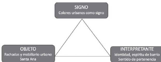
Figura 4. Elaboración propia.

En relación con este trabajo de investigación, es posible relacionar la triada semiótica de Peirce (2016) con los casos de estudio para analizar cada barrio desde una mirada individual. La interpretación para el caso del barrio de Santa Ana, originalmente un barrio obrero aledaño a la zona colonial del Casco Antiguo, poblado principalmente por trabajadores que servían a los residentes del Casco. El barrio de Santa Ana fue siempre considerado un arrabal, el lugar de residencia de la clase baja y donde se fusionaron diversas culturas que dieron paso a una parte de la identidad panameña. Como plantea Cabrera Arias (2014), Santa Ana continúa siendo un lugar alejado de la modernidad y del acelerado crecimiento económico panameño pero busca mantener el sentimiento de barrio y en sentido de comunidad que los une por lo que buscan preservar el patrimonio inmaterial de la zona antes de que la gentrificación los consuma. Por lo tanto, como puede apreciarse en la siguiente figura, para este caso de estudio, la interpretación de los colores de Santa Ana que ubican al color como signo, tiene como objeto las fachadas de las casas y edificios y su interpretante es el sentido de pertenencia, el barrio, la personalidad propia de la zona y las costumbres propias del barrio.