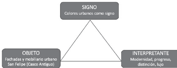
Figura 5. Elaboración propia

A partir de esta sección, el artículo se ocupa del papel del color como instrumento de significación, los referentes a los que apunta y el efecto del color en la interpretación. Para comprender la interpretación del significado que produce el color, es esencial examinar el proceso de significación. En los entornos urbanos, el lo que representa el color desempeña un papel fundamental en la construcción de la identidad. Aunque son muchos los enfoques que pueden contribuir desde la semiótica, la revisión bibliográfica examina las teorías más relevantes y adecuadas para este trabajo de investigación y sirve como introducción para comprender los significados de la identidad del color. De acuerdo con Charles S.