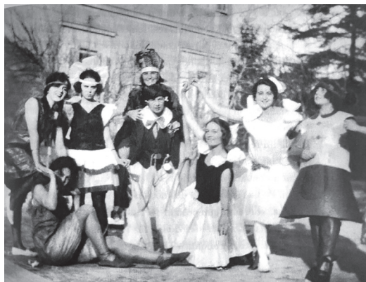
Figura 10. Fiesta de carnaval en la Residencia, 1923 (Pérez-Villanueva, 2011: 645).