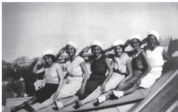
Figura 14. Residentes en el tejado de la Residencia de Señoritas.