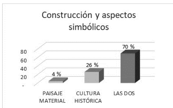
Gráfico 1. Aspectos simbólicos del hábitat de la Laguna de Colta

Los resultados de la plataforma investigativa permitieron establecer a través de la información develada en la encuesta la siguiente información: