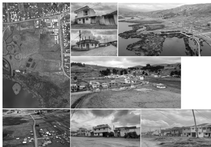
Imagen 2 Fachadas y estética de las viviendas en el área rural de la Laguna de Colta.