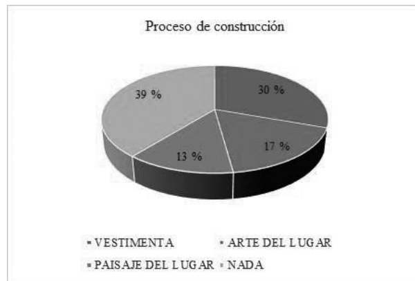
Gráfico 2. Proceso de construcción en las viviendas de la Laguna de Colta

que no fomentan la identidad de la cultura; en tanto que el 30% manifiesta que ellos consideran que la construcción se hace en referencia a la vestimenta, es decir al ser una zona geográfica con un clima frío ellos construyen sus viviendas en referencia al mantenimiento de un hábitat con cuidado climático; para otro grupo de encuestados representado por el 17% ellos indican que lo construyen en base al arte del lugar, es decir esta minoría si toma en consideración parámetros propios de la identidad cultural y finalmente el 13% declara que ellos al momento de generar la construcción habitacional en el sector tomó como referente el paisaje y su entorno como fuente de inspiración.