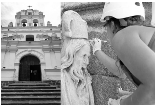
Imagen N°1: Limpieza y pintado

Limpieza y Repintado Selectivo: La limpieza inicial de la superficie afectada se llevaría a cabo utilizando métodos suaves que no dañen el sustrato subyacente, como el lavado con agua a baja presión o el uso de cepillos suaves, se eliminaría cuidadosamente la suciedad acumulada en las cornisas y otras áreas afectadas del frontón. Después de la limpieza, se evaluaría el estado de la pintura de lechada de cal existente. Las áreas donde la pintura esté descascarada o dañada serían preparadas para recibir una nueva capa de pintura y se aplicaría una nueva capa de pintura de lechada de cal utilizando técnicas de aplicación adecuadas para garantizar una cobertura uniforme y duradera.