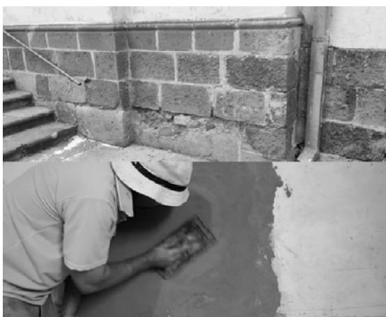
Imagen N°4: Limpieza reparación de revoque

Además de la reparación directa, se recomendaría mejorar la gestión del agua alrededor del templo para reducir la humedad por capilaridad y prevenir futuros problemas de desprendimiento y deterioro del revoque. Estas intervenciones buscan abordar las patologías identificadas de manera efectiva y duradera, asegurando la conservación y preservación a largo plazo del Templo de San Lázaro en Sucre. Es fundamental seguir prácticas de conservación apropiadas y realizar un mantenimiento regular para garantizar el éxito a largo plazo de estas intervenciones