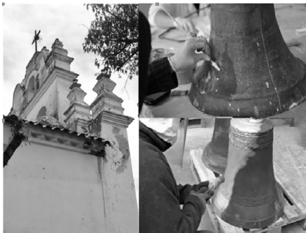
Imagen N° 2: Limpieza campanario