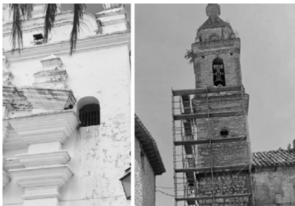
Imagen N°3: Limpieza y deshierbe

Eliminación y Prevención: Se procedería a la eliminación manual de la macrovegetación, como los claveles del viento y el moho, de la cruz del campanario, se utilizarían herramientas adecuadas para garantizar que se elimine toda la vegetación sin dañar la superficie de hierro fundido. Después de la eliminación, se aplicaría un tratamiento antivegetativo en la superficie de hierro fundido para prevenir la proliferación futura de vegetación no deseada. Este tratamiento puede ser en forma de un revestimiento o spray específico. Se consideraría también la instalación de un sistema de drenaje adecuado para evitar la acumulación de humedad en la zona y así prevenir futuros problemas de deterioro y proliferación de vegetación.