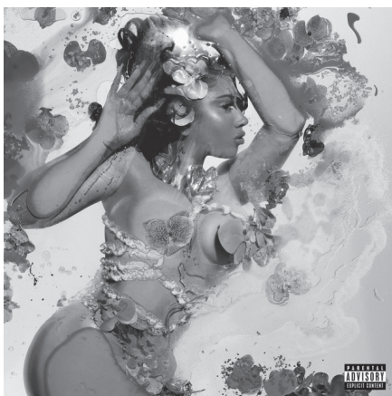
Figura 8. Orquídeas, videoclip Labios Mordidos . Fuente: (Kali Uchis & Karol G, 2024).