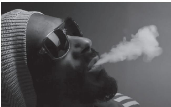
Figura 14. Motivos visuales del hip hop, videoclip On edge . Fuente: (Kali Uchis & Snoop Dogg, 2014).

La importancia de estas colaboraciones radica en que sirven como signos semióticos que representan su identidad y la riqueza cultural que existe en la artista. A través de la fusión de sonidos y estilos, Kali Uchis crea un espacio inclusivo en la música, desafiando las barreras culturales. Desde una perspectiva semiótica, estos elementos pueden interpretarse como significantes que generan significados complejos dentro de contextos culturales específicos.