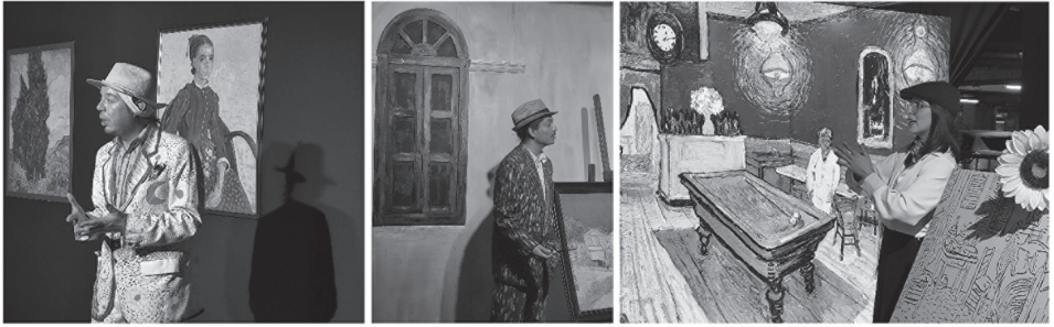
Figura 1. Fotografía de experiencia Van Gogh Vivo: Personajes que narran historias y guían la experiencia (Nota: experiencia Van Gogh Vivo, Chile-Arica, 2025)

La experiencia estética de Van Gogh Vivo (2025), no se detiene con el término del evento, pues se evidencia una manera diferente de distribución del arte y de lo sensible, con formas nuevas de participación, percepción y difusión de la experiencia. Inserta en un momento histórico conocido como la sociedad del espectáculo, a partir de ahí la experiencia inmersiva es remplazada por representaciones mediadas.