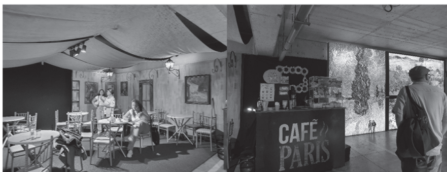
Figura 2. Fotografía de experiencia Van Gogh Vivo: Cafetería en la lógica de consumo y vínculo afectivo (Nota: Experiencia Van Gogh Vivo, Chile-Arica, 2025).

La culminación de esta experiencia, nos traslada a un entorno de consumo, con objetos a la venta que trascienden al espectador. Incluso lo inverosímil de encontrar una cafetería al estilo parisino, tipo réplica, (Ver Figura 2) nos vincula con los espacios habitados por el autor. En esta locación encontramos una conexión emotiva con el placer de la degustación culinaria, un vínculo afectivo que se entrelaza con el consumo. Una economía digital radicalizada sistemáticamente por las tecnologías y los flujos de información. Y aparece el sujeto moldeado por la atención. Quien se desenvuelve con facilidad en la economía del espectáculo y la vigilancia. En una sociedad hiperestimulada, donde la mirada del sujeto es fragmentada.