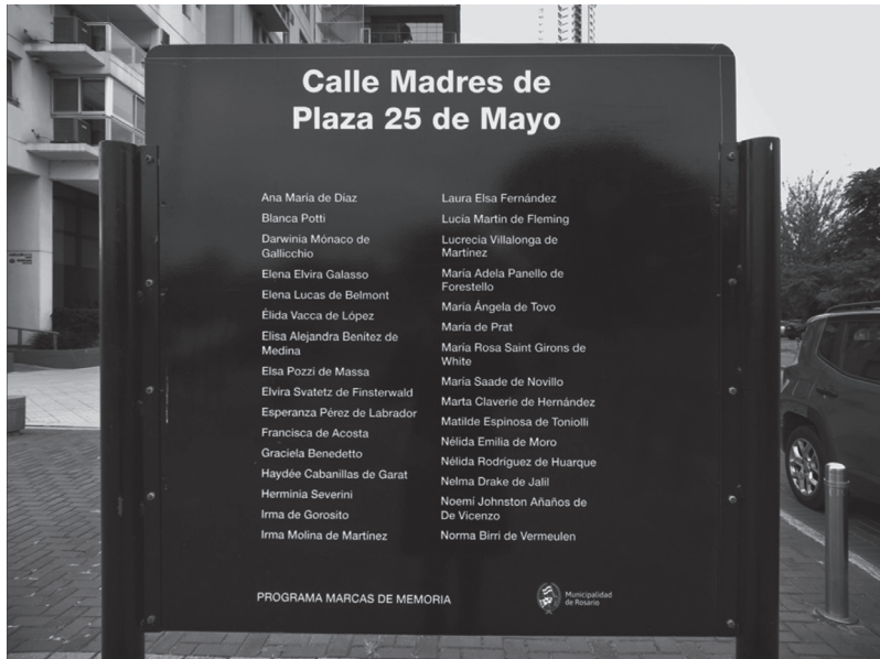
Figura 3. Señalética de la calle Madres de la Plaza 25 de Mayo.