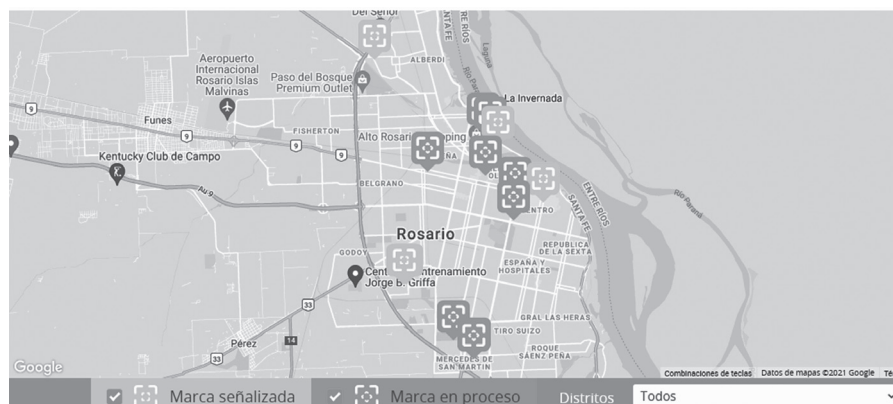
Figura 2. Mapa digital del Programa de Señalética de Marcas de Memoria.

En el mapa las marcas se encuentran organizadas y distribuidas según el distrito al que correspondan e identificadas con el color verde, si ya fueron señalizadas, y con el naranja si están pendientes o en proceso de señalización (ver figura 2).