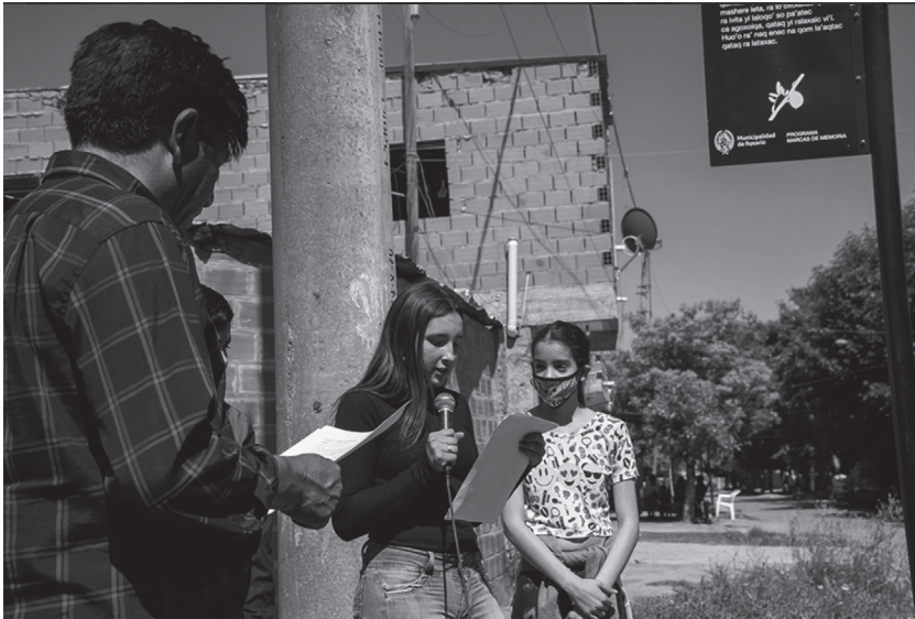
Figura 4. Acto de señalización del Pasaje Tacai en el Barrio Toba.

En este sentido, se evoca un relato común, un modo de vida y una lengua compartida por la comunidad de origen que reivindica y encarna, desde lo imaginario, su propia historia y la identidad cultural del barrio, como parte de una ciudad que hace ostensible sus fronteras simbólicas y materiales y expulsa hacia los márgenes. Se pone en valor una lengua que en la actualidad no es hablada ni conocida por las nuevas generaciones, tal como lo manifiestan referentes barriales y como se pudo observar en los dos encuentros realizados con estudiantes, docentes y directivos de las tres escuelas convocadas -N° 1380 “Roberto Fontanarrosa”, N° 1333 “Nueva Esperanza” y N° 518 “Carlos Fuentealba”- donde los maestros idóneos explicaron los significados de las palabras en qom, su pronunciación y los múltiples sentidos que se les atribuyen en el marco de su cultura y cosmovisión.