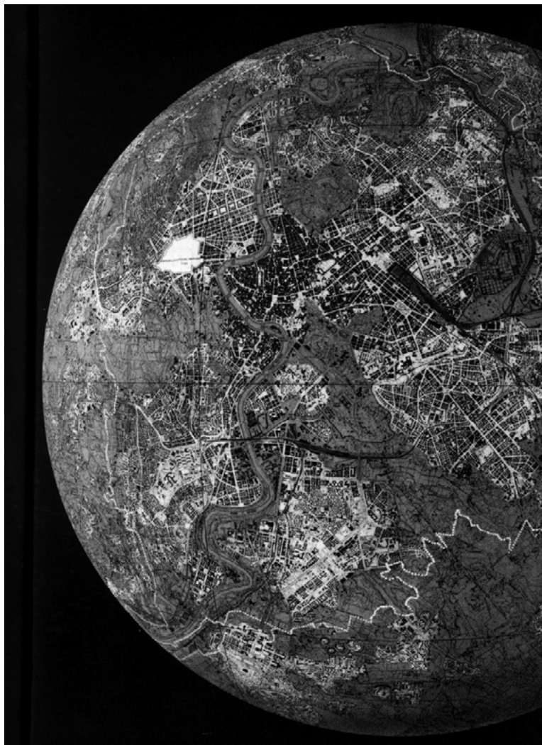
Figura 1. Planisfero Roma . Stalker, Transurbanza , 1995. Francesco Careri. La ciudad sin fin como planeta en el andar como práctica estética de Careri evidencia como presencia molar la línea dura de las metrópolis.