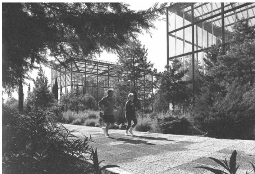
Figura 4. Jardín Natura, Parque Bicentenario, Ciudad de México 2011. Mario Schjetnan, Luis Matanzo, Gustavo Rojas, Marco A. González. La línea flexible consistiría en apropiar lugares de la ciudad postindustrial y de consumo para su reconversión en parques.

ciones de la refinería de Azcapotzalco, que cerró en 1988 después de haber contribuido por más de medio siglo a la producción de gasolinas, aceites y derivados de petróleo, se flexibilizan para dar lugar a más de 55 hectáreas de espacio público. El cambio en el uso de la forma como refinería se reconvierte como espacio público.