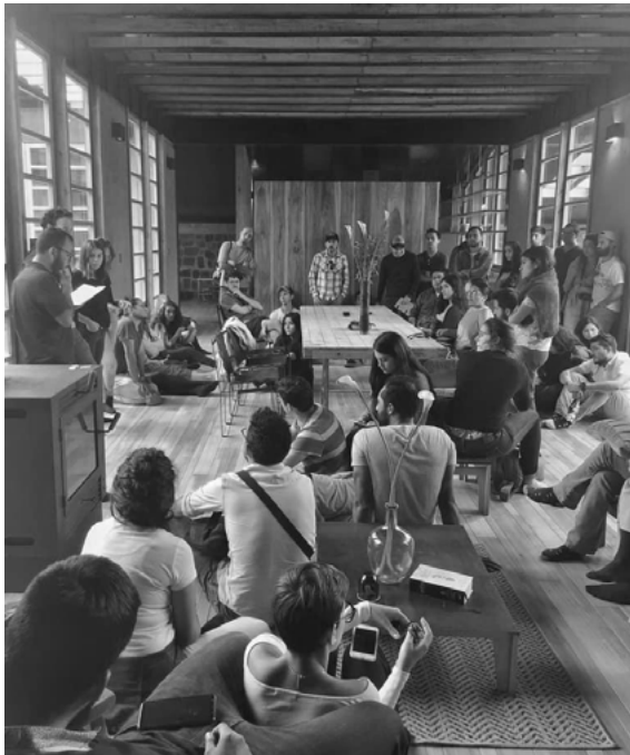
Figura 5. La casa para completar el paisaje: RAMA Estudio. Fuente: “La casa para completar el paisaje”, en Txt . Vol. 2 Ep. 1 La casa para completar el paisaje Casa Patios - RAMA Estudio (2017), pp. 6-7.