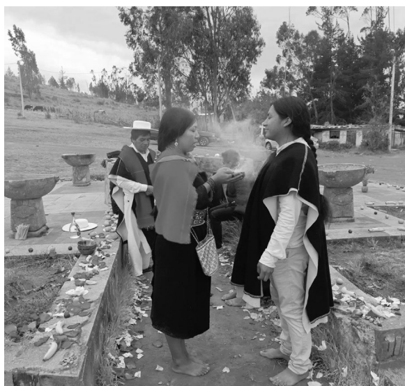
Figura 2. Ritual Salasaka en Chakana pamba en la celebración del Inti Raymi 2024.

En este sitio se realizan ceremonias de agradecimiento por las cosechas, se practican rituales para el buen vivir, depositando objetos y plantas para la limpieza espiritual y de enfermedades. También, los ancestros realizaban en este sitio ceremonias al sol, la Pachamama y las estrellas. Aquí se celebra la fiesta de los Caporales, Alcaldes o “varayuk”.