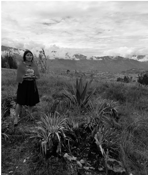
Figura 3. Mama Kinlli con vestigios de ceremonia ritual.

Mama Kinlly está ubicado a 5 minutos de Tayta Kinlly, este sitio tiene una gran conexión espiritual, antiguamente era el lugar donde se celebraba la fiesta del Rey y marcaba la culminación de todas las fiestas tradicionales de los Salasakas. Es un símbolo de poder, riqueza y fortaleza. Además, era considerado un espacio donde las mujeres acudían para pedir curaciones. Los Yachaks realizaban rituales de curación usando cánticos y un cuy, dejándolo como pago por la persona enferma. Hasta la actualidad las mujeres de la comunidad acuden a este sitio para dejar sus ofrendas de agradecimiento o pedir a la Pacha Mama por algún acto de bondad.