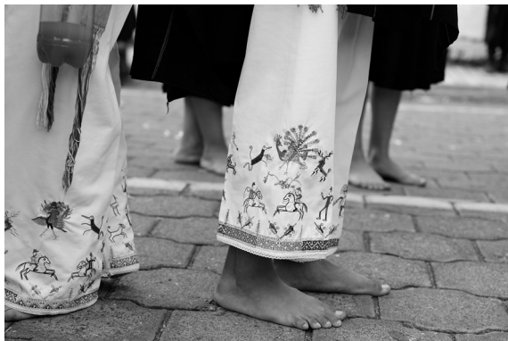
Figura 1. Bordados en pantalón yerbabuena.

Al referirnos al patrimonio, encontramos una conexión directa con la herencia, la memoria y la identidad. Esto incluye la lengua, los ritos, las creencias, los lugares y monumentos históricos, la literatura, las obras de arte, los archivos y las bibliotecas (UNESCO, s.f.).