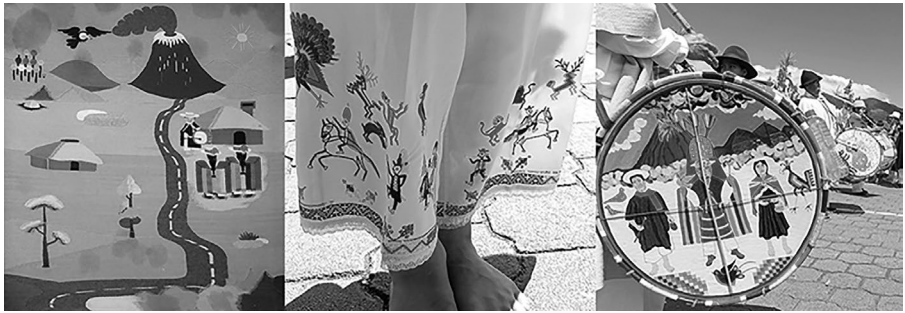
Figura 4. Diversas representaciones iconográficas de los rituales Salasakas en tejidos, bordados y pinturas.

La estética reflejada en las creaciones salasakas ( Fig. 4 ) no sólo muestra estilos artísticos, sino que también integra la forma gráfica con una función expresiva y comunicativa. Se trata de una ideografía simbólica que, como rasgo estilístico, tiende a la esquematización y hasta a la simplificación extrema de las formas. En los dibujos, la línea se convierte en elemento esencial, delimita planos, crea texturas y es la base de la abstracción. Podría decirse que estos dibujos logran una concepción cercana a la heráldica.