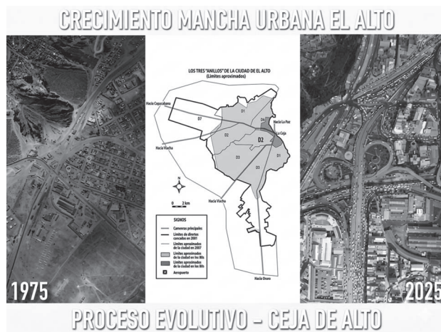
Figura 3. Crecimiento y consolidación de la mancha urbana 1975 – 2025, proceso evolutivo (referencial) límites 1950 – 1980 – 2007 y límites de distritos 2001, carreteras principales como ejes estructurantes. Elaboración propia, fotografías de autores no identificados, reproducido con fines académicos.