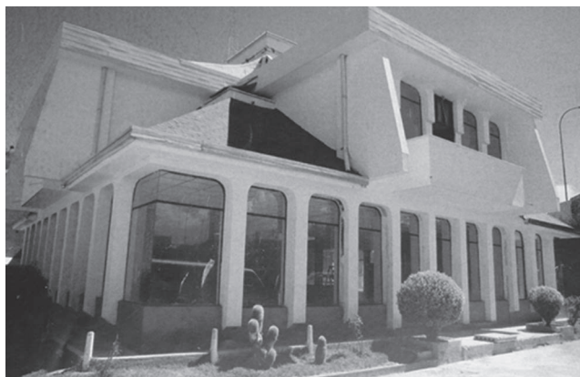
Figura 5. “Alcaldía Quemada”, era el Centro de Artes era la Casa de la Cultura, y eso fue hecho en el Gobierno de Lidia Gueiler 1980, posteriormente fue saqueado y quemada en 2003, de ahí el nombre Alcaldía Quemada. Fotografía de autor no identificado, reproducido con fines académicos.

La observación sistemática muestra que, en promedio, los entrevistados identificaron 42 puestos informales y 30 formales dentro de un área de 50 metros, lo que refleja una ocupación bastante alta del espacio público, entre el 51 y el 75%. Este nodo actúa como un corredor que conecta constantemente los otros dos hitos, siendo un lugar donde el comercio y el transporte son los protagonistas.