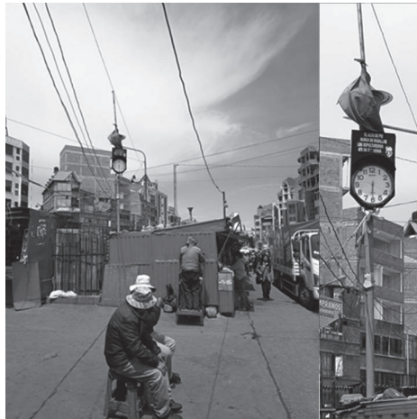
Figura 6. El Reloj “original” funcionaba con energía solar. Para no perder el lugar de