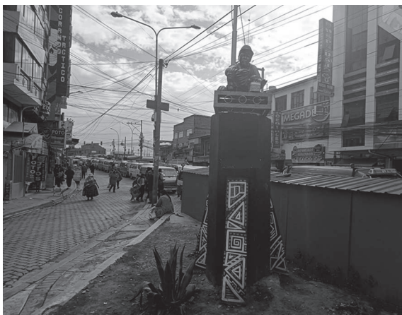
Figura 7. En abril de la presente gestión (2025) la Plaza del Lustrabotas ubicada en la Ceja, se entregó con todas sus mejoras a la Policía, para que se instale una caseta desde donde se reforzará el control policial para dar mayor seguridad a la población que transita por este sector.

Este hito muestra unas dinámicas propias de microeconomías tradicionales, como el lustrado de calzado, junto con actividades comerciales formales más recientes que se desarrollan en alrededores de la plaza con nuevas edificaciones en altura (centros comerciales).