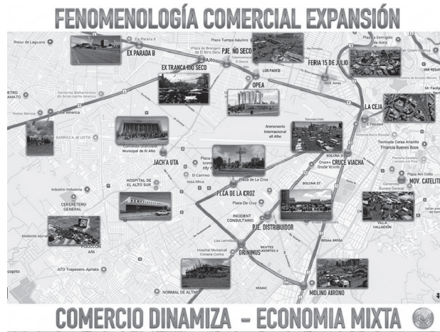
Figura 2. Expansión comercial en El Alto, fenomenología relevada de intersecciones en avenidas principales de la ciudad de El Alto, dinámica que refleja la apropiación del espacio.

En síntesis, el resultado del estudio se sostiene en tres pilares: