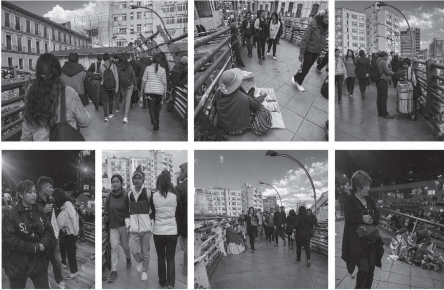
Figura 3. Vistas de las actividades cotidianas observadas en la Pasarela

De manera cotidiana, el tránsito o cruce peatonal se complementan con diversas actividades informales y efímeras de comercio, oferta casual de servicios, mendicidad, mirador eventual, punto de encuentro entre otras.