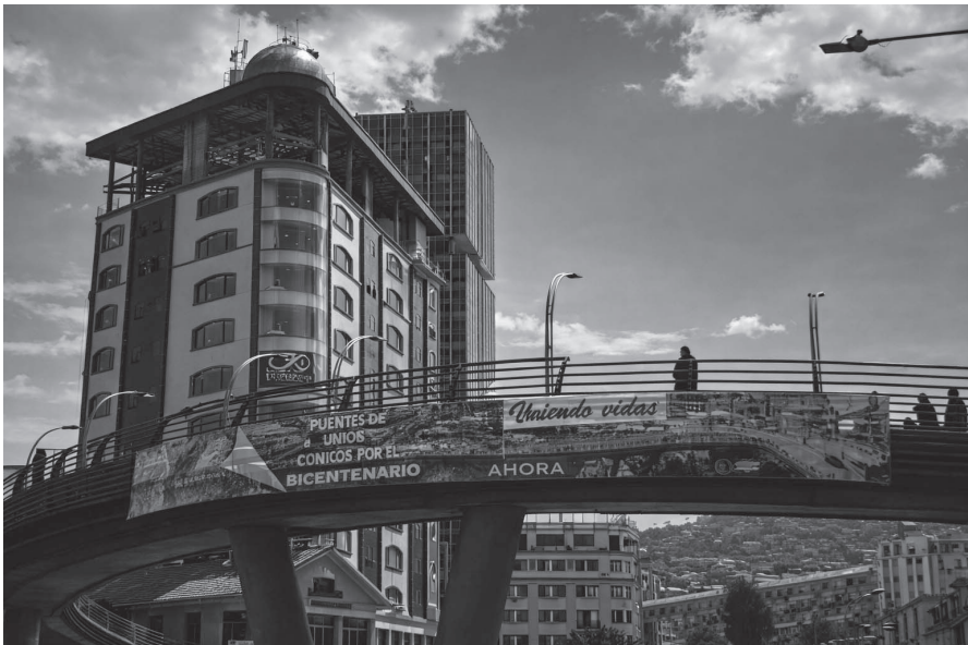
Figura 2. Vista de la pasarela Pérez Velasco

Este cruce peatonal elevado, tiene carácter de conexión obligatoria entre dos frentes, traspasando por encima la avenida Montes, una avenida vehicular de alto flujo. La Pasarela tiene una longitud de 63 metros lineales, cuenta con cuatro rampas de acceso, su altura máxima es de 6,5 metros y el ancho de la rampa es de 4,20 metros. Su estructura es de hormigón postensado con cimentación de pilotes.