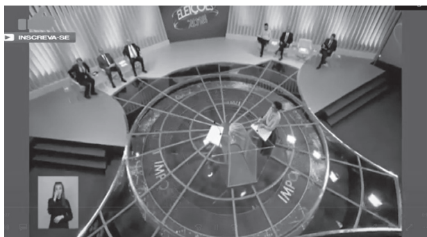
Figura 1. La puesta en escena del debate de la cadena Globo disimula la ausencia del candidato J. Bolsonaro.

Un observador muy incisivo podría atender a un desbalance menor: a un lado de la pantalla hay tres candidatos; al otro, cuatro. Por lo demás, el diseño escenográfico, sobrio y sencillo, no señala en pantalla el espacio de un cuerpo ausente.