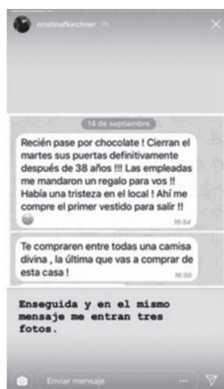
Figura 2. Story emitida desde la cuenta de Instagram de Cristina Fernández de Kirchner.