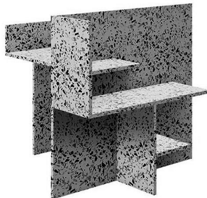
Fig.- 33. Escritorio Radical Fakeo de Patricia Urquiola para Cappellini (2018) Mesa Gong Terrazzo de Giulio Cappellini para Capellini (2018). 39

Siguiendo con el terrazzo, Patricia Urquiola creó el sofisticado escritorio “Radical Fake”, disponible en dos alturas, está equipado con estanterías incorporadas, formadas por la intersección de diferentes elementos lineales que crean perspectivas divertidas e inesperadas. Ambas versiones, alta y baja, están realizadas en tablero de madera con un acabado de "efecto de terrazzo", con acentos que evocan el terrazzo veneciano, realizado mediante Digital Print Inkjet (Fig.-33).