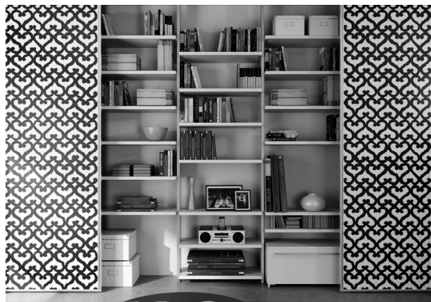
Fig.- 30. Aliante System de DE-Rosso. 36