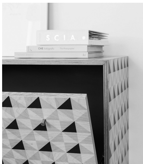
Fig.- 28. Tinello italiano, de Marcello Panza para Covo. 34