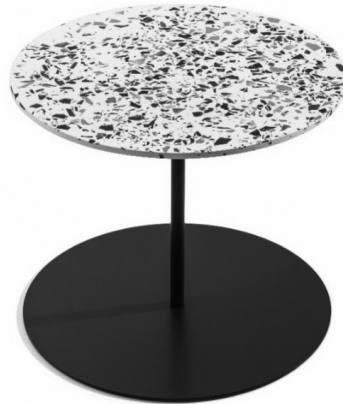
Fig.- 32. Mesa Gong Terrazzo de Giulio Cappellini para Capellini (2018). 38

y de fabricación de la empresa. No se trata solo de una decoración simple, sino de un enfoque innovador para la definición de materiales capaces de satisfacer las demandas funcionales y estéticas al mismo tiempo, en este caso mediante las tecnologías de Digital Print Inkjet (Fig.-32).