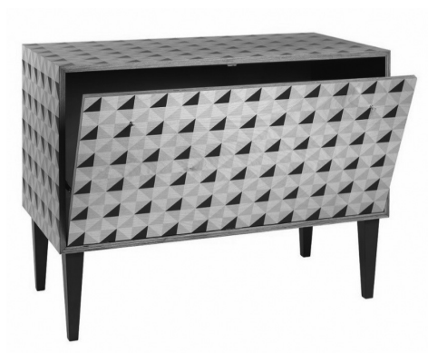
Fig.- 27. Tinello italiano, de Marcello Panza para Covo. 33

COVO con el producto “Tinello italiano” de Marcello Panza, desarrolla una colección de contenedores inspirados en la cultura y tradición italiana (Fig.-27), abordando diversas tipologías: cofres, tocadores, contenedores, en tres motivos decorativos realizados en madera de abedul laminada, con impresión digitalmente directamente sobre los tableros (Fig.-28).