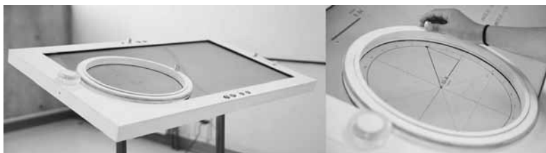
Figura 2. Prototipo 2. Vista general (izquierda) Detalle del “Anillo” en uso, donde se observa parte de la GUI en la pantalla LCD (derecha)

La GUI es controlada a través de controladores físicos, que por medio de gestos con las manos (apretar, desplazar, girar), permiten a los usuarios modificar los elementos digitales en la pantalla. El controlador principal es lo que se denomina “Anillo” es un aro de 32 centímetros que se puede girar en ambas direcciones con la mano. El Anillo controla el ángulo principal dentro del Círculo Unitario, que en consecuencia determina los valores de seno y coseno. Otros controladores adicionales tienen formas más cotidianas—como perillas (knobs) y sliders— que controlan parámetros adicionales del modelo y permiten navegar en la progresión de contenidos.