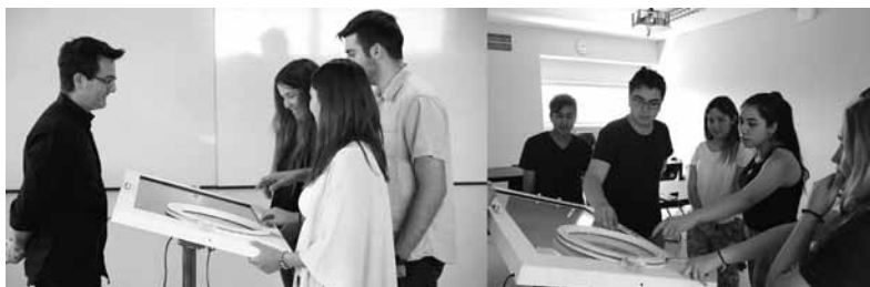
Figura 3. Sesiones con Prototipo 2, donde se aprecia a los participantes colaborando.

una vez que haya validado que el grupo ha obtenido la comprensión de cada una. Los estudiantes también tienen la libertad de navegar escenas cuando así lo deseen, por ejemplo para volver atrás a revisar algo que les ayude a comprender la escena actual. El diseño de la experiencia permite que cada grupo avance a su propio ritmo y a la vez da flexibilidad para el que el Facilitador se enfoque más en ciertos aspectos dependiendo de la dinámica de cada grupo.