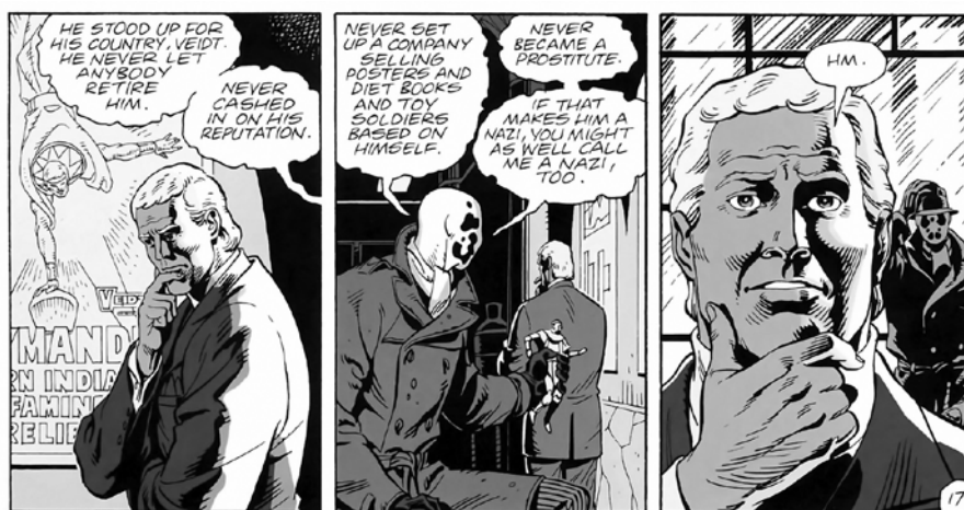
Figura 2. Moore, Alan y Gibbons, Dave (1986) Watchmen , #2, Nueva York: DC Comics, p. 17.

¿Cómo acabó Rorschach por convertirse en un “héroe del pueblo”? Moore nunca ocultó que era, precisamente, todo lo contrario. La primera vez que le vemos en acción, éste entra un bar donde se reúne gente más o menos marginal y le empieza a romper los dedos a uno de sus clientes, al azar, esperando que el resto confiese quién ha matado al Comediante, un ex agente de la CIA. Cualquier persona sensata le habría dicho a Rorschach, ¿y esta gente qué puede saber sobre algo así? Si el Comediante trabajaba para el gobierno, ¿no sería mejor preguntarle a la gente apropiada? Pues no. Para Rorschach, la respuesta está en los pequeños crímenes que se cometen en la calle. Y aunque, lógicamente, no obtiene ninguna respuesta de los ladrones de poca monta a los que amenaza, eso no impide que acabe de romperle los dedos a ese pobre diablo, ni tampoco anotar en su diario, al salir del bar: “dejo a las cucarachas humanas para que discutan sobre su heroína y sobre su pornografía infantil” (Moore y Gibbons, 1986: capítulo 1, p. 16). Su perpetuo oponente, Ozymandias, tiene una palabra para definir los métodos y la actitud de Rorschach y esa palabra comienza por la letra “N” (Figura 2).