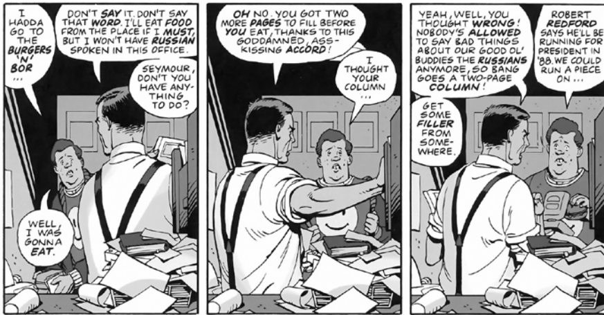
Figura 4. Moore, Alan y Gibbons, Dave (1986) Watchmen , #12, Nueva York: DC Comics, p. 32.

La premisa consiste en situar la nueva serie en 2019, el año de su estreno, pero en la misma realidad alternativa que Moore y Gibbons presentaron en 1986. La inmersión del espectador en este mundo ficticio se va produciendo de forma gradual. Poco a poco vamos descubriendo qué es lo que ha pasado durante esos treinta y cuatro años; pero, durante los primeros episodios ni siquiera importa demasiado lo que ha ocurrido con los personajes originales: la serie se centra en los cambios producidos en la sociedad estadounidense tras la hecatombe neoyorkina provocada por Adrian Veidt.