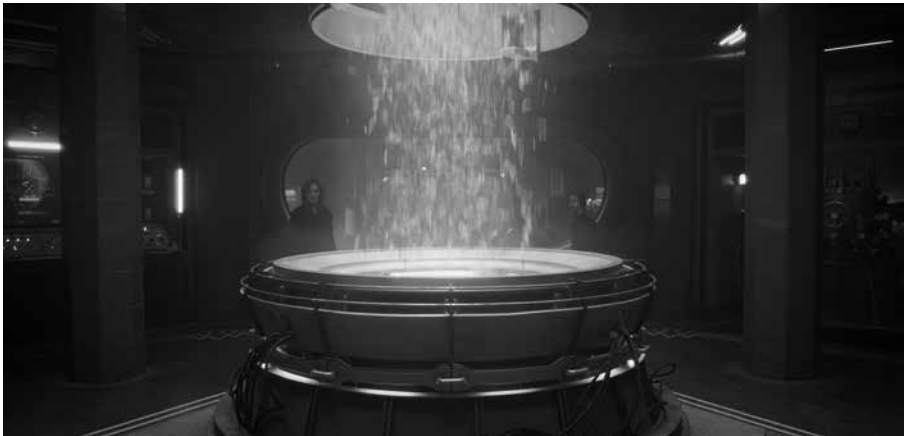
Figura 7. Lindelof, Damon (2019) Watchmen , episodio 9, HBO.

Sin embargo, en muchos otros sentidos, los Estados Unidos de Redford no son tan diferentes de los Estados Unidos de Trump. Para poder seguir manteniendo el sistema en marcha, la población ha de ser sometida a recordatorios constantes del shock primigenio. En su refugio antártico, Ozymandias ha dejado programadas repetidas lluvias de calamares, de un tamaño más reducido, con un algoritmo aleatorio para que el origen y el propósito de éstas siga siendo un misterio (Figura 7). Como en El señor de las moscas , la idea de una amenaza constante resulta la única forma de seguir manteniendo una cierta paz social. Y es necesario reinstaurar el shock de vez en cuando con continuas “reposiciones”, como bien lo define Lady Trieu, la hija de Ozymandias, en el último capítulo de la serie. Trieu está reduciendo a Ozymandias al nivel de un Milton Friedman barato: chocho, senil e incapaz de hacer otra cosa más que aquella que lo hizo famoso, repitiéndola hasta la náusea.