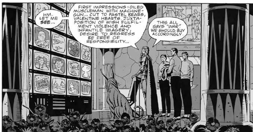
Figura 6. Moore, Alan y Gibbons, Dave (1987) Watchmen , #10, Nueva York, DC Comics, p. 8.

como Thatcher, Pinochet o Reagan. Alguien que controlase a la población mediante el control de la economía; o mejor dicho, mediante el control de los deseos y de los miedos. Alguien, como Ozymandias, que pueda prever si se avecina una guerra con solo mirar qué tipo de anuncios echan por televisión. “Músculos aceitosos con rifle, osos pastel, corazones de San Valentín, yuxtaposición de deseo, violencia e imágenes infantiles, deseo de estar libres de responsabilidad” (Figura 6). Alguien que sepa que, una vez analizada la información, y ante la fatalidad de una guerra, el objetivo no es comprar armas ni municiones (la necesidad de estos productos solo dura lo que dura la guerra) sino invertir en la industria pornográfica y en productos relacionados con la maternidad. Alguien, en definitiva, como Jeff Bezos, que ha sido el gran beneficiado con esto de no querer y no poder salir de casa, sin ser capaces de renunciar a nuestros hábitos consumistas.