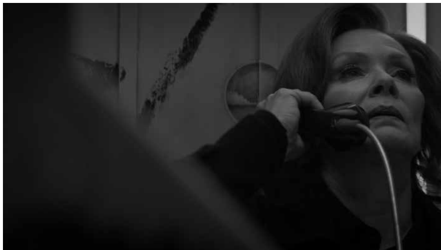
Figura 10. Lindelof, Damon (2019) Watchmen , episodio 3, HBO.