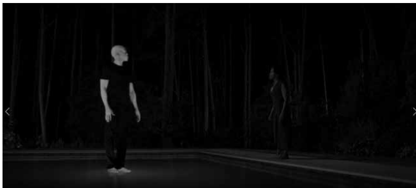
Figura 8. Lindelof, Damon (2019) Watchmen , episodio 8, HBO.

La situación es la siguiente: ha habido un asesinato, el del jefe de policía de Tulsa, a cuyas filas pertenece Sister Night. Su asesino es, al parecer, el antiguo Justicia Encapuchada, un hombre afroamericano de casi cien años que no puede levantarse de su silla de ruedas, pero que en el pasado fue el primero de los vigilantes disfrazados. Justicia Encapuchada le ha contado a su nieta la razón por la que ha matado a su jefe. Además de liderar las fuerzas policiales, ostentaba un alto cargo en el Ku Klux Klan; e incluso seguía guardando en su armario el tradicional traje blanco con capucha. Poco después, Justicia Encapuchada desaparece misteriosamente en un coche que se eleva en el aire, por lo que Sister Night tiene que investigar por su cuenta el pasado de su jefe. Y días después tiene con su marido la conversación de la que estamos hablando. Cuando el Doctor Manhattan se ofrece a mediar entre la Sister Night de 2019 y el Justicia Encapuchada de 2009 para que estos puedan hablar entre ellos acerca de lo que se saben, se produce la paradoja. Sister Night le pregunta por el hombre asesinado, pero Justicia Encapuchada no sabe de quién le está hablando. Entonces ella le habla sobre su identidad secreta como líder del Klan y Justicia Encapuchada decide matarlo.