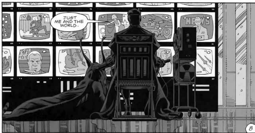
Figura 1. Moore, Alan y Gibbons, Dave (1986) Watchmen , #10, Nueva York: DC Comics, p. 8.

Sin embargo, fue en Watchmen (1986-87) donde hizo su retrato más exacto del tipo de personalidad que da origen al héroe neoliberal: Ozymandias, rey de reyes; un hombre que se disfraza de un antiguo conquistador, pero que en realidad no es más que un hombre de negocios; alguien dispuesto a tratar a los seres humanos como números si con ello puede hacer que avance su idea de un mundo mejor (Figura 1).