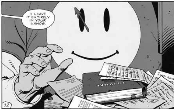
Figura 3. Moore, Alan y Gibbons, Dave (1986) Watchmen , #12, Nueva York: DC Comics, p. 32.

La publicación del diario de Rorschach solo habría conseguido que el mundo se precipitara a una catástrofe aún mayor. Eso es lo que implica el final de la serie de cómic de Alan Moore y Dave Gibbons. Por supuesto, la situación política que presentaba es solo una metáfora, que pese a todo lo que nos pueda insinuar sobre nuestra realidad actual,