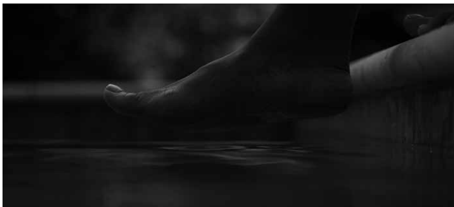
Figura 9. Lindelof, Damon (2019) Watchmen , episodio 9, HBO.

El plano se corta en el momento en que Sister Night pone el pie en el agua. Lindelof ha asegurado ya varias veces que su intención no era hacer un cliffhanger y que, de hecho, le aterraba la posibilidad de que alguien lo entendiese así (Sepinwall, 2019). Al contrario, su intención era construir un plano simbólico que abriese la puerta a dos posibles desenlaces: que Sister Night se haya convertido en la nueva Doctora Manhattan, o que acabe remojada como un pollo en el fondo de la piscina (Bastién, 2019). En el fondo, se trata de un reflejo de la viñeta con la que terminaba el cómic de Moore y Gibbons. El diario de Rorschach apareciendo sobre una pila de cartas al director del New Frontiersman , y la mano del redactor, dispuesto a tomar un documento de la pila para publicarlo. Nunca supimos si tomaría o no el diario de Rorschach. Esa tensión entre un final y otro (el triunfo del neoliberalismo en caso de que no lo publicasen, o el triunfo de la extrema derecha en caso de que sí) es la misma tensión que se produce en el final de la HBO.