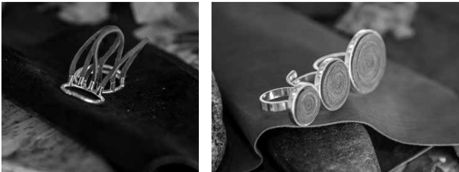
Figura 3. Joyería realizada con tiras de cuero.

Joyería con cuero. Este proyecto propone la experimentación del cuero como material de alta gama para aplicaciones a pequeña escala. Uno de los problemas medioambientales encontrados en la primera etapa, fue el proceso de corte en muchos productos de cuero. En este proceso se generan una gran cantidad de tiras de cuero residual que terminan en vertederos de basura. El uso de estas tiras es un desafío, ya que varían en tamaño. Este grupo decide usar el residuo a pequeña escala como una oportunidad de aprovechamiento. Las pequeñas tiras de desecho de cuero se cortan en tiras aún más pequeñas de 1 o 2 mm y se utilizan en la joyería como elementos decorativos. Las joyas ganan una textura colorida junto a los anillos de plata haciéndolos únicos y especiales (Figura 3).