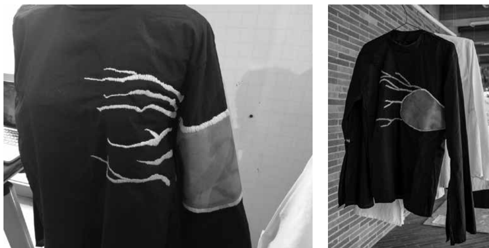
Figura 4. Ropa realizada evidenciando cortes de cuero con marcas y cicatrices.

Cuero Malo. Este proyecto propone utilizar las partes no utilizadas del cuero, que tradicionalmente se tiran a la basura por contener cicatrices y marcas. La industria del cuero considera las cicatrices y marcas de vida o las marcas de los propietarios del ganado, elementos a evitar dado que puede arruinar la uniformidad y calidad de un producto. Los diseñadores encontraron que la cantidad de material descartado con estas características es tan abundante que se puede utilizar con otro propósito. Los diferentes parches de cuero se aplican creativamente a la ropa y accesorios para resaltar las diversas cicatrices que las personas tienen durante su vida. Un enfoque de personalización puede permitir a los clientes seleccionar la parte del cuero y la posición de la prenda donde puede resaltar el lugar de una cicatriz o una marca. Este grupo trabajó de la mano con un grupo de personas que habían padecido cáncer o habían tenido algún tipo de accidente, descubriendo una oportunidad para crear prendas personalizadas ubicando el parche de cuero en el lugar donde se encuentra la cicatriz de la persona. Esta aproximación de proyecto permitió desarrollar prendas únicas para sus usuarios y le ayudaron a su vez a exhibir de manera diferente, algo que antes les causaba pena (Figura 4).