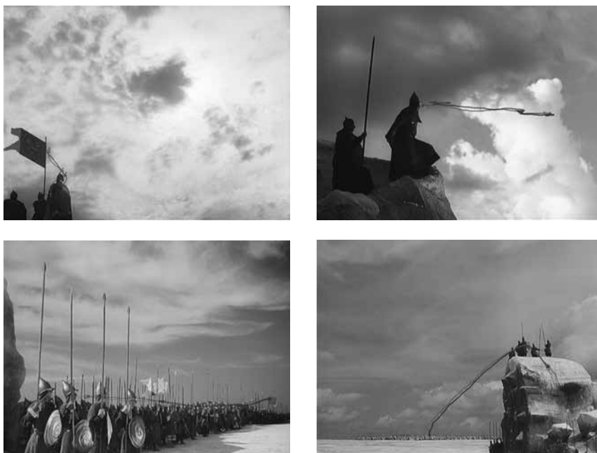
Figura 1. Fotogramas seleccionados de la composición a partir de la escena de Alexander Nevsky (1938) 2 .