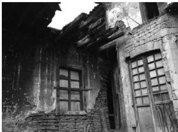
Figura 5. Tramos de losa y estructura de madera destruidas con piezas faltantes, enlucidos viejos y desprendido de muros portantes de piedra, tabiques de bahareque en ruina. Elaboración propia.

El inmueble de la ex fabrica “El Peral” actualmente se encuentra en malas condiciones y con características de deterioro importantes que van a ser tratadas para su rehabilitación se tomará mucho en cuenta el análisis de sus pisos, cubiertas y en su estructura por completo (Figura 5).