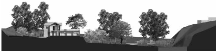
Figura 6. Implantación de la ex fábrica El Peral. Elaboración propia.

En base al análisis del usuario se tomó en cuenta la personalidad, cualidades, los aspectos conceptuales y físicos de los músicos, las preferencias, y los aspectos emocionales en donde se pudo concluir que son personas con cualidades únicas, los mejores músicos tienden a tener una atracción a la música desde muy pequeños por lo que su carácter es muy emocionante y cambiante, tienen los sentidos muy desarrollados por lo que se dejan impresionar mucho a través de ellos, lo que les hace ser sensoriales, se adaptan fácilmente a los ambientes y salen todo el tiempo de su zona de confort debido a que les gusta experimentar. Buscan a todo lo que ven sentido con lo que más les gusta como es la música y lo relacionan todo con ello. Los músicos prefieren un espacio con mucha iluminación, multifuncional que se acople a las funciones de cada artista, que tenga una buena acústica, y buena ventilación, que tenga varias zonas para una mejor preparación de sus presentaciones. Por naturaleza los usuarios para la casa de la música son muy emotivos y reaccionan de manera inesperada a cada una de las situaciones en las que se encuentran, puesto a que si se encuentran en lugares poco estéticos su estado de ánimo cambia y no se sienten a gusto, en cambio cuando ellos se captan a través de la vista lugares atractivos el humor cambia y su sentido del humor es mucho más relajado ya que relaja las tensiones de percepción que tienen al llegar a un lugar.