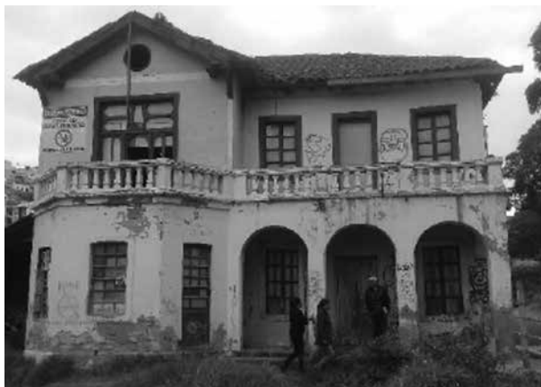
Figura 1. Estado actual de la ex fábrica El Peral.