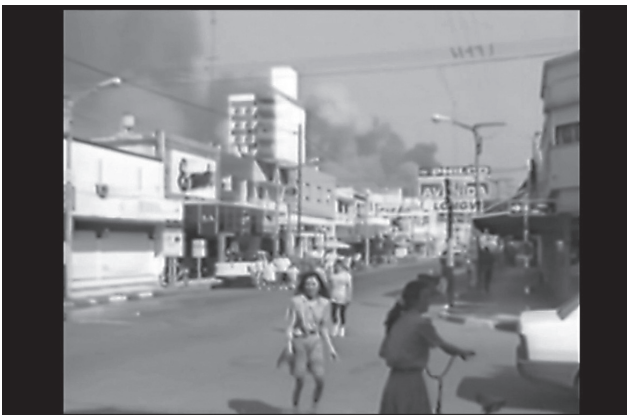
Gentileza de Natalia Garayalde