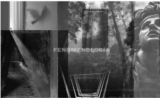
Figura 3. Paradigma fenomenológico. Moreno M. Valeria. 2020. Elaboración propia.

Para la indagación del marco conceptual nos centramos en el paradigma fenomenológico, en el cual vamos a indagar al sujeto que lo va a vivenciar y al objeto que va a responder a sus necesidades. Edmund Husserl 3 expresa que “la fenomenología pura es la ciencia de la conciencia pura” (s.f.). Comenzamos definiendo al fenómeno como una manifestación de energía o materia en la conciencia humana. Entendiendo esto, ¿qué es la fenomenología? Es el estudio de cómo, los fenómenos que percibimos a través de nuestros sentidos, impactan en nuestra conciencia.