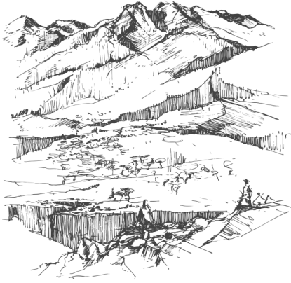
Figura 7. Conexión. Moreno M. Valeria. 2021. Elaboración propia.

Dada la particularidad de nuestras intenciones, logramos una transición de una relación arquitectura y paisaje a una relación arquitectura, paisaje y personas, quienes son los visitantes.