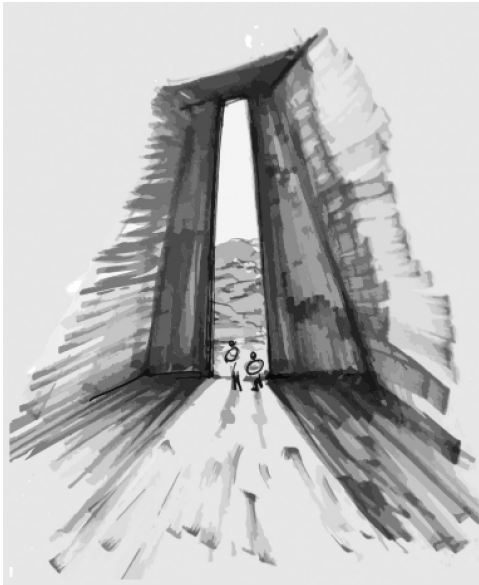
Figura 8. Move por los espacios animándonos a descubrir lo que los sentidos y nuestra conciencia nos dicen. Moreno M. Valeria. 2021. Elaboración propia.

Dada la particularidad de nuestras intenciones, logramos una transición de una relación arquitectura y paisaje a una relación arquitectura, paisaje y personas, quienes son los visitantes.