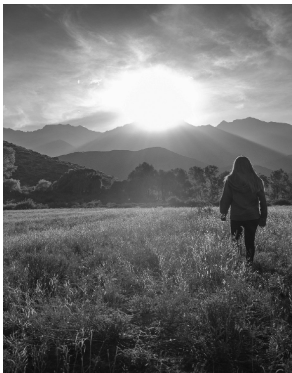
Figura 2. Buscar el equilibrio. Costanzo M. Florencia. 2020. Fuente propia.

Encontramos un desequilibrio, del hombre consigo mismo y con la naturaleza. Por ello proponemos los siguientes objetivos: empatizar, reconciliar y despertar. Surgiendo así la siguiente pregunta: ¿Cómo podemos volver a encontrar el equilibrio?