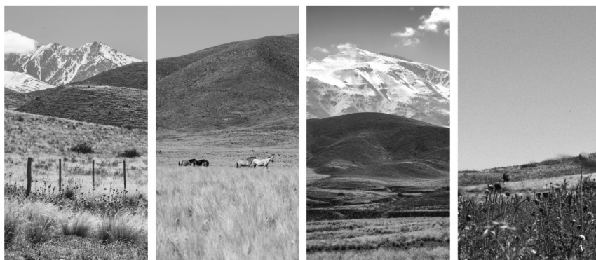
Figura 6. Valores del lugar. Costanzo M. Florencia y Moreno M. Valeria. 2021. Fuente propia.

Ciertamente te sientes, en la contemplación, transportado al fondo de este paisaje, crees respirar el aire puro y sereno, te parece sentir el murmullo del arroyo, y así atraído al interior del círculo sagrado de la vida misteriosa de la naturaleza, sientes la vida, eternamente activa de la creación (Carl Gustav Carus, s.f.).