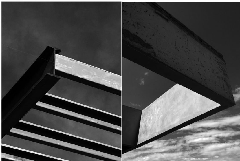
Figura 3. Estructura. Yvan Conna. Casa NS. Mendoza. Arg. 2018. Figura 4. Gravedad en tensión. Yvan Conna. Casa BL. Mendoza. Arg. 2020