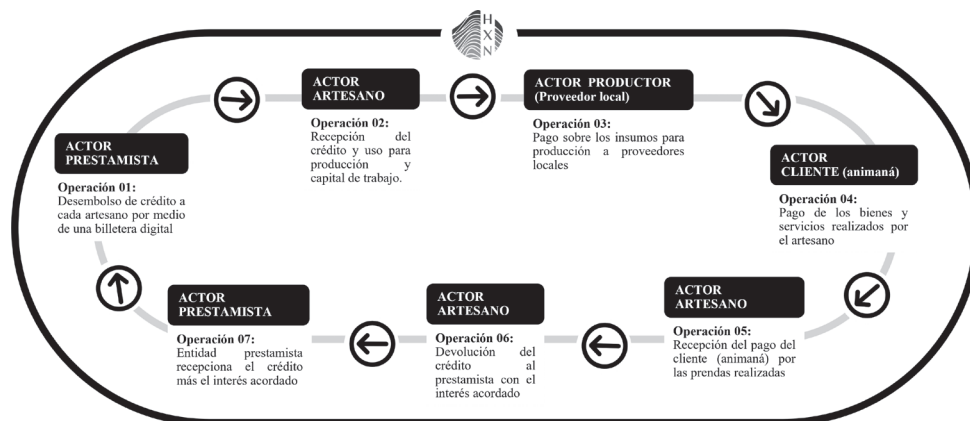
Esquema n.4: Diagrama de dinámica de devolución de crédito.