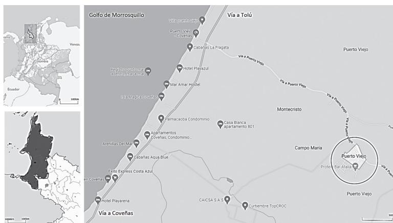
Figura 1. Localización del asentamiento indígena Zenú, cabildo menor de Puerto Viejo, en Tolú, Sucre, Colombia.

Una de estas comunidades Zenú, asentadas en el Golfo de Morrosquillo, Sucre, al norte de Colombia (Ver Figura 1), es la perteneciente al cabildo menor de Puerto Viejo, en Tolú, ubicado a 50km de la capital del departamento. Se identifican como descendientes de la familia finzenú, los cuales como grupo tienen el propósito del reconocimiento de derechos ancestrales y culturales, así como su desarrollo integral a través del mejoramiento de su calidad de vida (Figueroa, 2021).