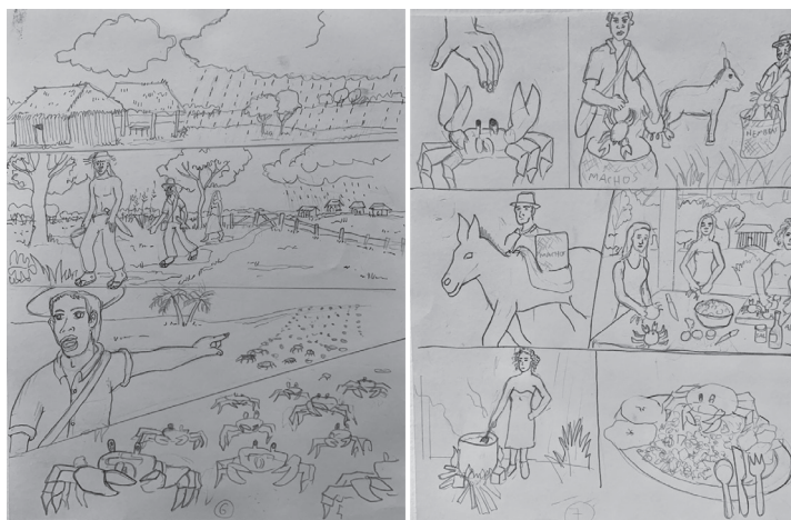
Figura 5. Sketch del taller de construcción narrativa colaborativa (Fuente: Jesús Buelvas, 2022).

Las secuencias narrativas fueron ilustradas en el taller colaborativo, con la participación de los habitantes más jóvenes y con las entrevistas realizadas a los pobladores con mayor edad y conocimiento referencial de la comunidad. Así, estas serán asignadas a las plataformas más adecuadas para su reproducción y almacenamiento a modo de acervo con libre acceso para su divulgación y resignificación de la identidad patrimonial-cultural.