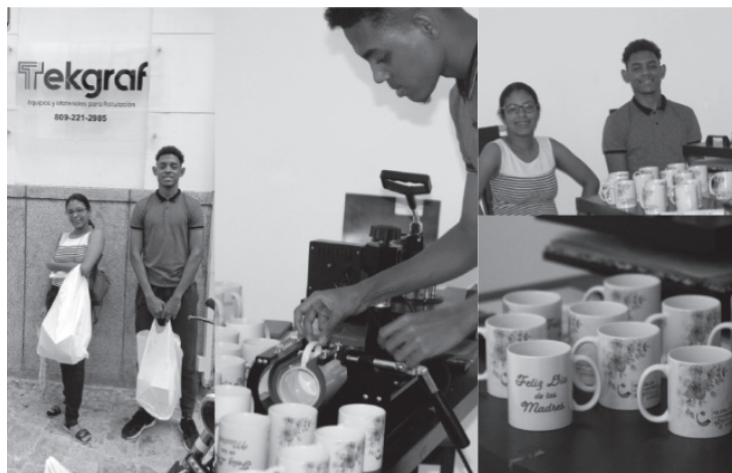
Imagen 6. Proceso de acompañamiento a emprendedores sordos

Siendo sensibles a las necesidades especiales de las mujeres, hemos desarrollado el proyecto mayormente para ellas, aunque cualquier persona en situación de vulnerabilidad puede ser miembro del programa. Así hacemos convocatoria principalmente a grupos de mujeres con discapacidad para capacitar a los integrantes, y luego darles las herramientas necesarias para el desarrollo de su emprendimiento. La Fundación de Guerreras en Ruedas ( FUNRUEDAS ) y el Círculo de Mujeres con Discapacidad ( CIMUDIS ) han sido particularmente asociaciones femeninas beneficiarias de nuestras iniciativas.