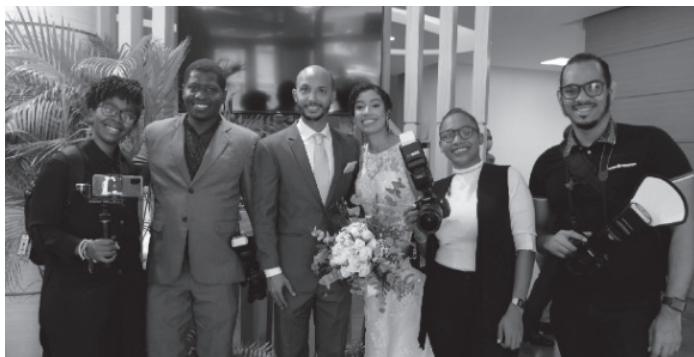
Imagen 2. Sordos y oyentes haciendo una boda

Los alumnos del proyecto fotográfico reciben una educación continua. Desde el 2019 a la fecha, han participado de varios talleres, tres de ellos con maestros fotográficos de la talla de Gustavo Pomar o Elsa Weppler, desde Argentina. También hemos dado el ejemplo de inclusión laboral teniendo a dos jóvenes trabajando regularmente en nuestro equipo de fotografía. Siempre es grato ver la cara de asombro de las personas al saber que los sordos también pueden trabajar al igual que los oyentes, y realizar una labor con excelencia.