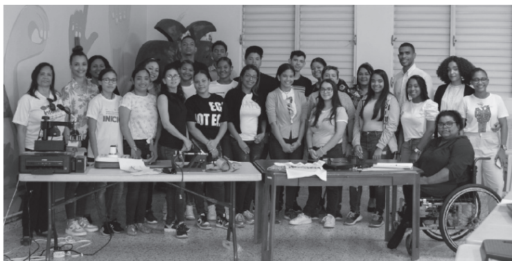
Imagen 5. Participantes del primer taller de Sublimación

Fieles a nuestra filosofía de Aprender para Emprender, quisimos llevar a la práctica lo que predicamos y ofrecer a los participantes de Sublimación y Serigrafía la oportunidad de también desarrollar negocios a partir de los nuevos conocimientos adquiridos. La mayor parte de los participantes son mujeres, muchas de ellas madres que luchan para ofrecer a sus hijos un bienestar económico y social. Muchas de esas mujeres habían manifestado el deseo de iniciar su propio negocio, pero no tenían los recursos monetarios para hacer una inversión en equipos y empezar su negocio.