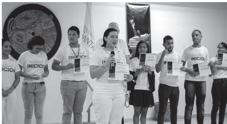
Imagen 1. Algunos de los graduados de la promoción INICIOS

A finales del año 2019, concluimos los primeros cursos de la iniciativa de enseñanza fotográfica a sordos y oyentes bajo el concepto que llamamos Inclusión Inclusiva (trabajamos siempre con siempre grupos mixtos para así generar mayor nivel de comprensión e integración entre sordos y oyentes). Organizamos en noviembre del 2019 la Primera Exposición Fotográfica para Sordos y Oyentes en el país. Enseñamos a los jóvenes que a través de la fotografía ellos pueden ganarse la vida honradamente (Imagen 1).