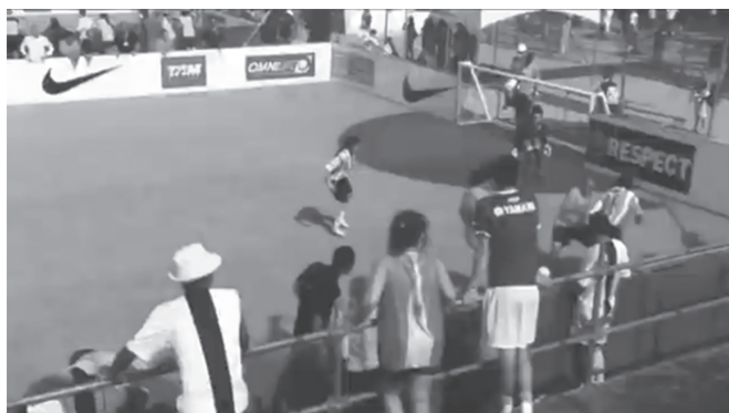
Imagen tomada del documental Mujeres con pelotas Gentile, G. y Balanovsky, G. (Codirectores) (2013). Mujeres con pelotas [Documental]. Argentina. San Telmo Producciones.

Comienzo de la canción “Se van”. Fuente: