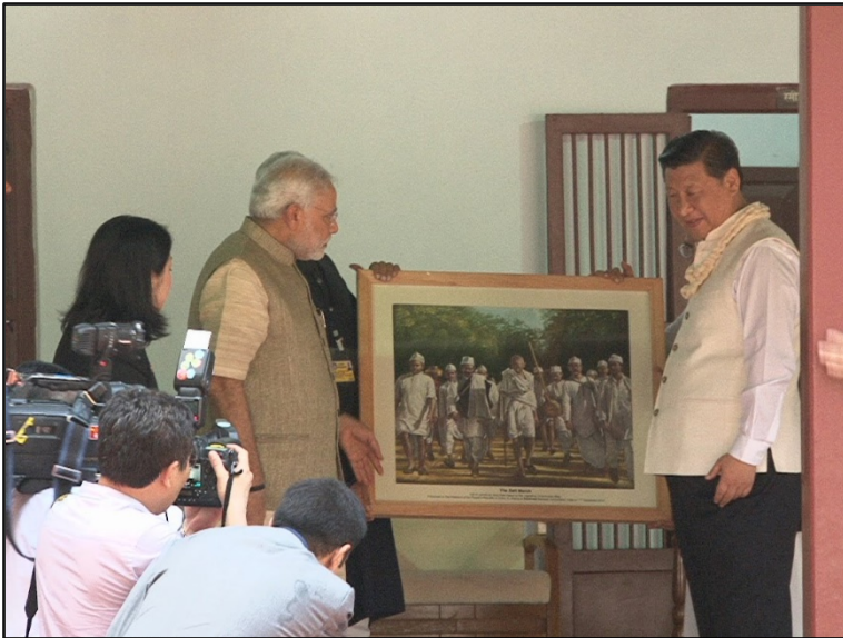
Fig2. Xi Jinping visita SabarmatiAshram, residencia de Mahatma Gandhi.

Significativamente, también en el marco del ideario independentista promovido por Gandhi, la rueca representa la dignidad del trabajo, la equidad y la unidad. En una clara evocación de estos ideales, Modi invitó a su par chino a ejecutar el movimiento del giro de la rueda para iniciar el hilado. Las imágenes de este acontecimiento circularon en los medios de comunicación a nivel local e internacional como un signo manifiesto de las intenciones de mutuo reconocimiento y valoración en este nuevo marco decorrespondencia..