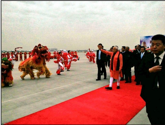
Fig.4. Modi arriba a Xi'an, capital de Shaanxi y renovado centro de poder en el diseño de la nueva Ruta de la seda.

En medio de un despliegue importante de artistas, músicos y bailarines de danzas tradicionales, Modi fue recibido con una gran ceremonia en Xi'an, actual capital de la provincia de Shaanxi, antigua capital de la Dinastía Tang y nuevo centro de poder en el renovado corredor de la ruta de la seda y a su vez provincia natal ( lao jia , en mandarín) del propio presidente Xi Jinping.