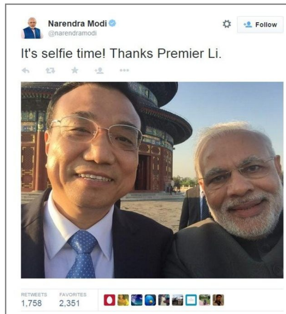
Fig.10 Imagen publicada por Modi en su cuenta de Twitter.

Si bien el acceso a las redes sociales Facebook y Twitter está restringido desde China, Modi reprodujo en sus cuentas la instantánea con el primer ministro chino. Esta imagen fue en pocas horas una de las más vistas y compartidas en India.