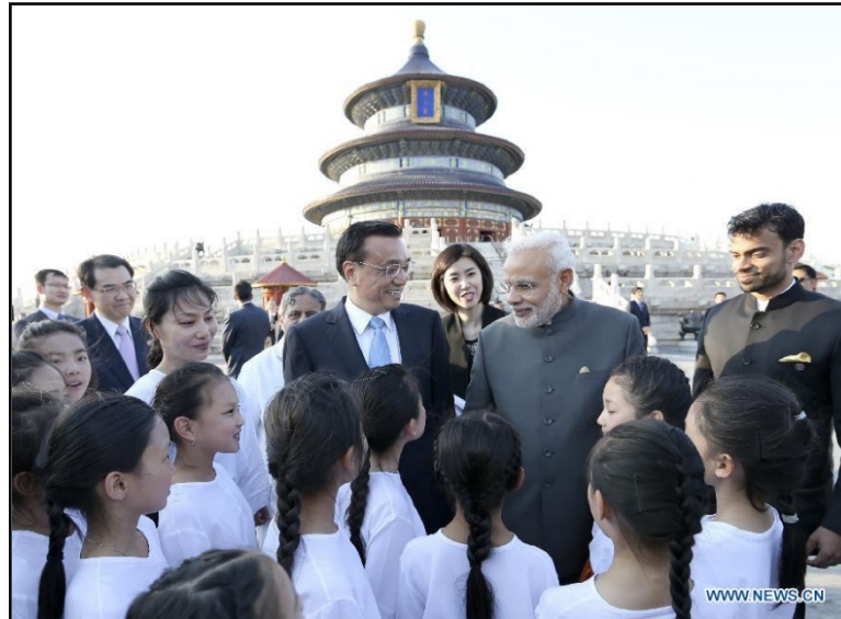
Fig.8 Encuentro con jóvenes frente al Templo del Cielo.

La intención de fortalecer las relaciones entre ambas se cristalizó en una amplia sesión conjunta de yoga y tai-chi. Montada como un espectáculo que se televisaría en simultáneo en ambos países, un grupo de niños de la India practicaron taichi mientras que otros, chinos, practicaron yoga.