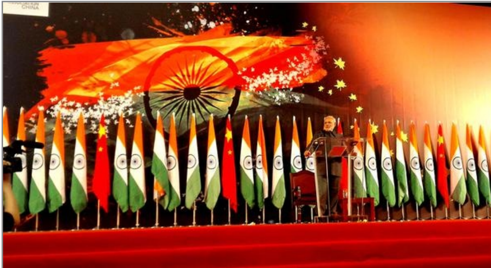
Fig.11 Modi en el Foro de Jefes Ejecutivos de la India y China en Shanghai.

Finalmente, en la última escala de su recorrido por China, Modi participó del Foro de Jefes Ejecutivos de la India y China, donde se reunió la comunidad de negocios de ambos países. Allí se enfatizó la importancia de la interacción entre líderes y empresarios de estados o provincias de ambas naciones.