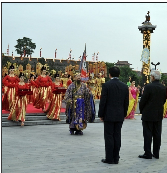
Fig.5. Recepción de Modi en Xi'an con artistas que representan el estilo ceremonial de la dinastía Tang.

En medio de un despliegue importante de artistas, músicos y bailarines de danzas tradicionales, Modi fue recibido con una gran ceremonia en Xi'an, actual capital de la provincia de Shaanxi, antigua capital de la Dinastía Tang y nuevo centro de poder en el renovado corredor de la ruta de la seda y a su vez provincia natal ( lao jia , en mandarín) del propio presidente Xi Jinping.