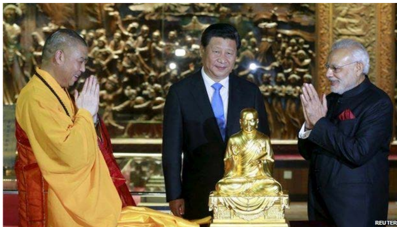
Fig. 7 Modi recibe una estatua en oro de Buddha como obsequio del abad del Templo Da Xingshan, en Xian.

Modi continuó su recorrido por otro sitio que ejemplifica la herencia cultural clásica del diálogo entre China y la India: el templo budista Da Xingshan—Templo de la gracia maternal—, donde se emplaza la Gran Pagoda del Ganso Salvaje, construida a mediados del siglo VII. Allí se exhiben como tesoros lossutras, cuyas antiguas traducciones del sánscrito al chino fueron realizadas por el monje XuanZang. Este lugar fue en el pasado uno de los nodos en la antigua ruta de la seda y uno de los centros de traducción más importantes de textos budistas en Asia. En la imagen, Modi recibe una estatua dorada de Buddha como obsequio del abad del templo.