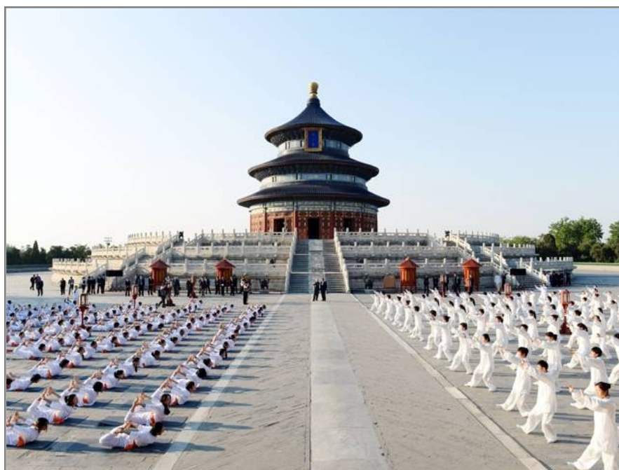
Fig.9 Sesión conjunta de yoga y taichi frente al Templo del Cielo en Beijing.

La intención de fortalecer las relaciones entre ambas se cristalizó en una amplia sesión conjunta de yoga y tai-chi. Montada como un espectáculo que se televisaría en simultáneo en ambos países, un grupo de niños de la India practicaron taichi mientras que otros, chinos, practicaron yoga.