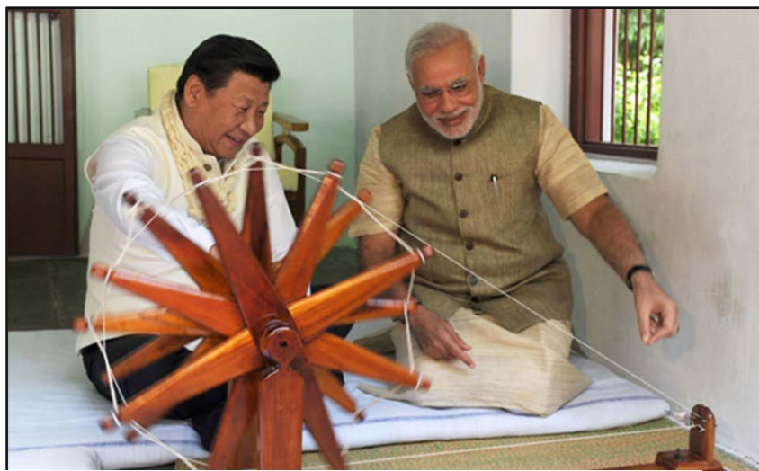
Fig 3. Bajo la guía atenta de Modi, Xi hace girar la rueca ( charkha ) para hilar khadi , símbolo del programa constructivo de Gandhi.

Significativamente, también en el marco del ideario independentista promovido por Gandhi, la rueca representa la dignidad del trabajo, la equidad y la unidad. En una clara evocación de estos ideales, Modi invitó a su par chino a ejecutar el movimiento del giro de la rueda para iniciar el hilado. Las imágenes de este acontecimiento circularon en los medios de comunicación a nivel local e internacional como un signo manifiesto de las intenciones de mutuo reconocimiento y valoración en este nuevo marco decorrespondencia..