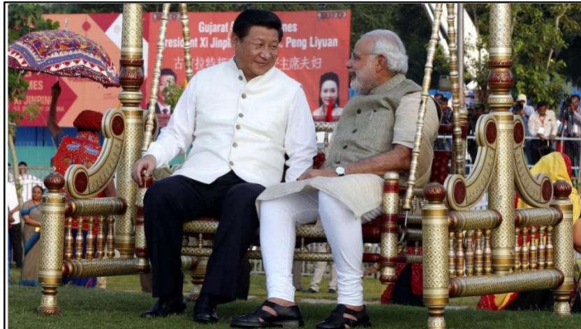
Fig 1. Xi es recibido por Modi en Ahmedabad (Gujarat).

mercado de productos agrícolas, al farmacéutico y de exportación. A la vez, se permitiría a los productores de ambos países el aprovechamiento de oportunidades para fusionar sus recursos creativos, artísticos, técnicos, financieros y publicitarios. De este modo, se le daría apoyo al crecimiento de determinados sectores, como la industria audiovisual en la India, a ganar mayor presencia en los mercados globales (Unnithan, 2014).