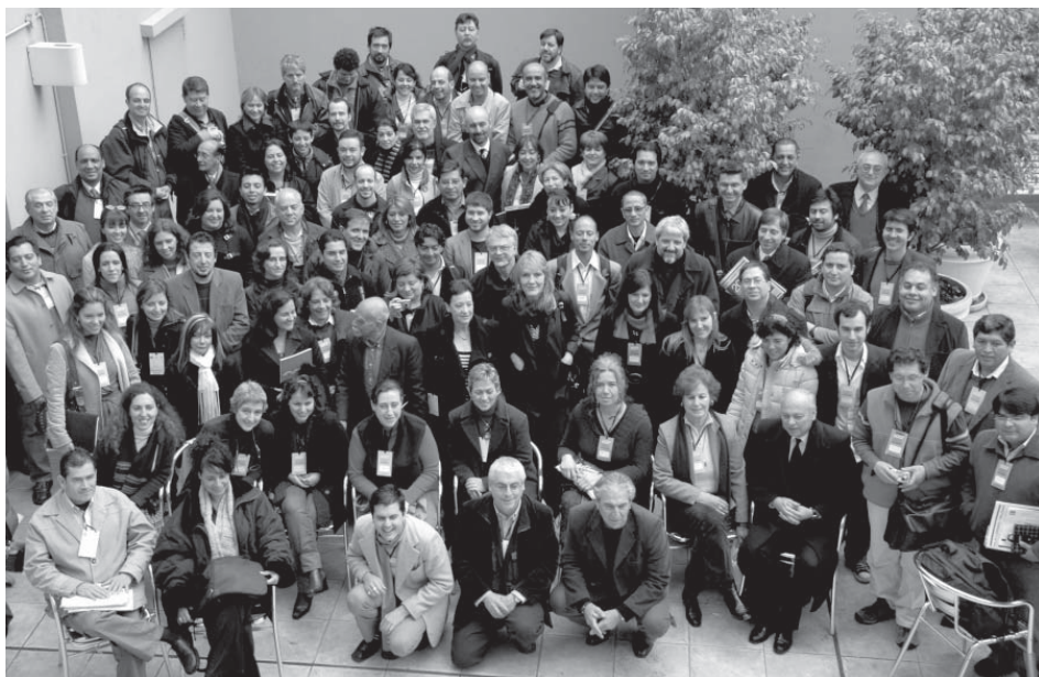
Académicos participantes del II Plenario de Foro de Escuelas de Diseño en la Universidad de Palermo (2 de Agosto 2007)