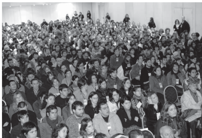
Cierre del Encuentro Latinoamericano de Diseño 2007