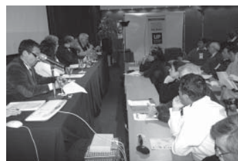
Acto de Apertura del II Foro de Escuelas de Diseño. Universidad de Palermo, 30 de julio 2007

qué hay del diseño en las ciencias, la tecnología, las artes, las artesanías... en suma: encontrar las intersecciones del diseño con los diversos modos de pensar y hacer en un mundo cada vez más complejo, donde toda exclusión debe leerse como negación u obstinación, no como ausencia. (...) Desde la docencia surge la necesidad de la epistemología desde el mismo momento en que se formulan las preguntas: "¿Cómo diseñar?, ¿Para qué diseñar?, ¿Con qué diseñar?" y se llega al deseo de una epistemología cuando se buscan respuestas a las preguntas "¿Por qué diseñar? y ¿Para quién diseñar?" Por último, la posibilidad de la epistemología está dada desde la misma praxis del diseño, entendiendo esta praxis no como el mero hecho de hacer algo, sino como la integración de la teoría y la práctica, hacia donde nos dirigimos. Queda hecha entonces la invitación para que ustedes, como responsables de la formación de los futuros diseñadores de sus respectivos países, se sumen a la propuesta de construir una epistemología del diseño a partir de nuestras raíces comunes. (pág. 42)