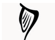
Embajada de la República de Irlanda