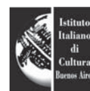
Embajada de la República Italiana / Instituto Italiano de Cultura de Bs. As. (IICBA)