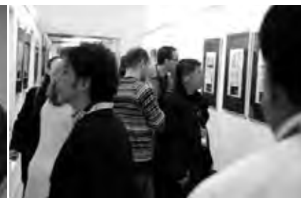
Muestra de trabajos seleccionados