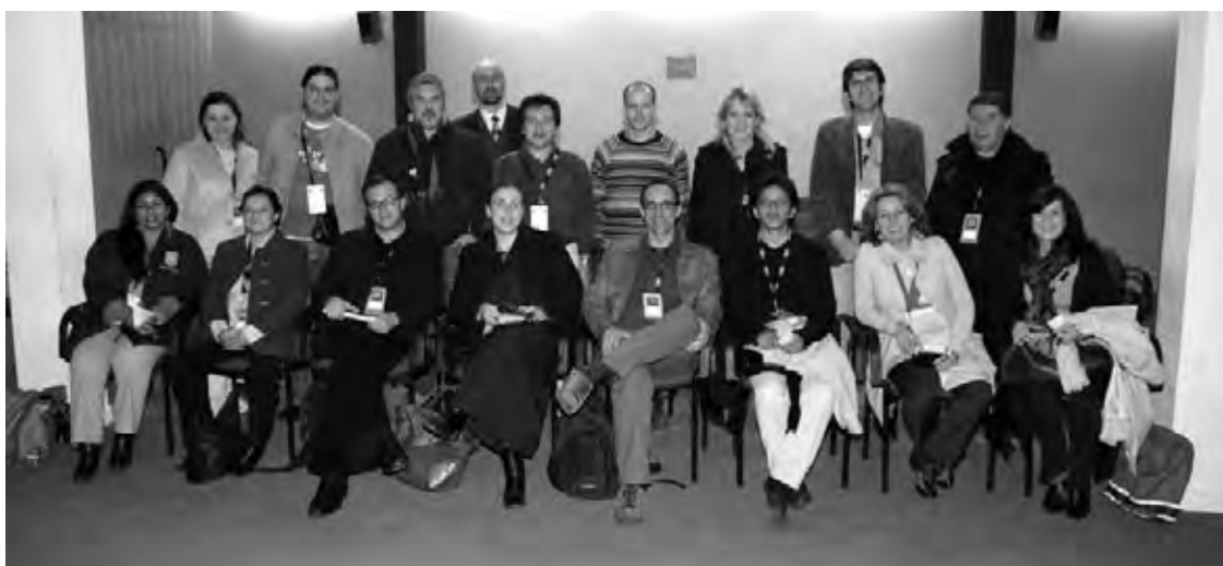
Miembros del Jurado del Foro de Escuelas de Diseño