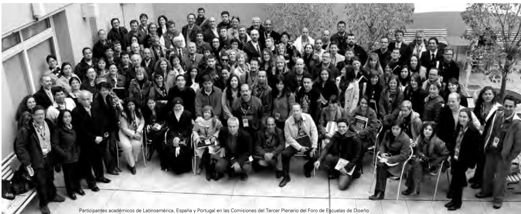
Participantes académicos de Latinoamérica, España y Portugal en las Comisiones del Tercer Plenario del Foro de Escuelas de Diseño