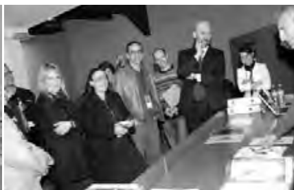
El jurado en funcionamiento