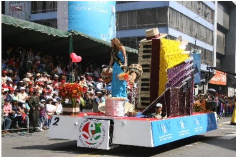
Figura 31. Acordeón (Fiesta de las Frutas y de las Flores, 2008)

alegórico, esta situación se corrige y de cierto modo se disimula en las imágenes de los años posteriores, como se puede observar en la figura 29 y 30.