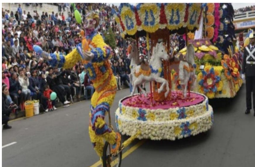
Figura 29. Carrusel de ilusión (Fiesta de las Frutas y de las Flores, 2017)

Sin embargo, con una mirada interpretativa más amplia, se advierte la alegoría que significa volver a soñar. Recordemos que el terremoto del 5 de agosto de 1949, representó una catástrofe de 6 mil fallecidos y 100 mil ambateños sin hogar, que no se había visto desde hace más de 250 años cuando otro terremoto causó la muerte de dos mil personas en un instante. Parte de la resiliencia del ambateño es la búsqueda de lo bueno que tiene la vida. Carrusel de ilusión precedido por un saltimbanqui muestra la alegría de saberse vivo, de poder reiniciar, de saber que a pesar de las adversidades existen un mañana que podría ser mejor. A la vez, la obra invita a valorar la imaginación infantil, ella toda inocente debe hacer frente a la orfandad, la calle y el sufrimiento físico, ¿cuál sería el dolor sin la capacidad de volver a emocionarse, de tener ilusiones y esperanzas?