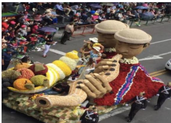
Figura 39. Herencia de ambateñidad (2018)

El dulce encanto de vivir (Figura 40) presenta un arreglo floral de gran calado en el que se encuentra una reina con un cesto tradicional. Sin embargo, lo más llamativo de este arreglo floral son las dos máscaras que se ubican en la carroza. Una de ellas evoca la alegría y la otra la tristeza. Desde luego, no puede existir la una sin la otra. El tamaño en el que han sido confeccionadas las máscaras rompe totalmente con la visión costumbrista de representar flores, frutas, indígenas o ambateños laboriosos. En este caso, las máscaras evocan un arte poco desarrollado en la ciudad, el teatro. Pese a que el Ambateño es tradicionalmente conocido por su gran sentido del humor, alegre en las fiestas y centro de atención de un baile popular, poco se ha desarrollado en el ámbito teatral. De hecho, no existe un teatro que funcione frecuentemente para presentar a agrupaciones teatrales. El teatro en la ciudad tiene un papel de salón de actos solemnes o presentaciones musicales y artísticas en general. El símbolo del pájaro representa las emociones y cómo guías espirituales unen las esencias de la tierra con la satisfacción de probar las delicias de los frutos combinados con la sutileza de su formación en flores.