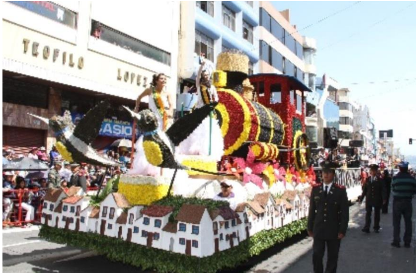
Figura 30. Sueños (Fiesta de las Frutas y de las Flores, 2013)

En la Ilustración 31 se observa un acordeón decorado por completo de flores. La música es un particular que identifica a los ambateños, de hecho, muchos artistas nacionales e internacionales nacieron en esta ciudad. Existe un reconocimiento de la labor y el esfuerzo cultural de los ambateños. Sin embargo, el acordeón es un instrumento particularmente interesante pues entraña el instrumento primordial de los carnavales. El taita carnaval que suele ser quien ameniza esta fiesta en el campo suele ir acompañado de varios músicos que entonan guitarras o maracas como se puede observar en la imagen, pero cuando no va acompañado de varios al menos se hace acompañar de un acordeonista. Con el acordeón se canta y se baila “a la voz del carnaval” que es prácticamente el himno del carnaval ecuatoriano.