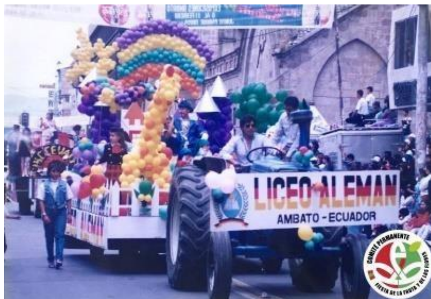
Figura 47. Liceo Alemán (Fiesta de las Frutas y de las Flores, 1997)