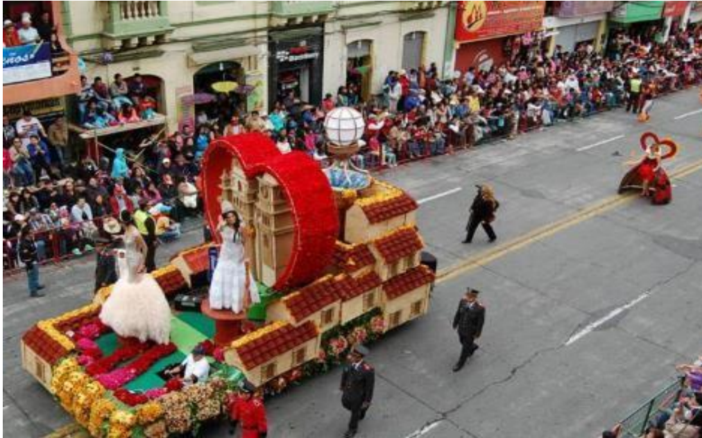
Figura 45. Ambato vivo en tu corazón (2015)

La artesana Verónica Chiquin (entrevista personal) señala que ella siempre trata de “resaltar los árboles, el fruto y el pan que tiene la ciudad, en mi trabajo busco que los ambateños rescaten y mantengan sus huertos y grandes jardines, mi trabajo lo realizo con la ayuda de cinco personas”.