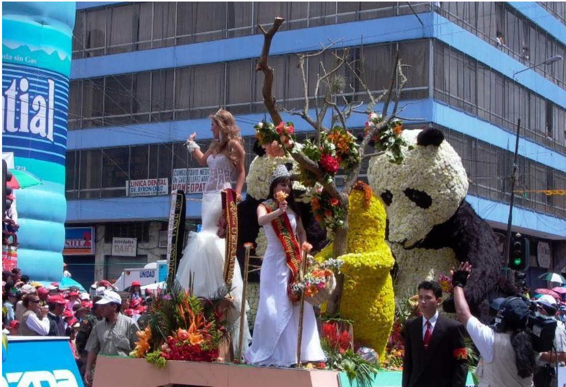
Figura 44. Familia de osos panda (2006)