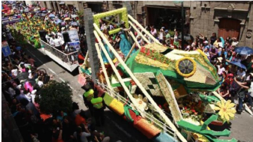
Figura 38. Jambato (2014)

se presenta un anfibio de gran tamaño que abraza a las flores y frutas de la fiesta. El anfibio es un indicador biológico de la calidad ambiental de un hábitat, si bien es cierto, la rana prácticamente ha desaparecido de la ciudad, su recuerdo en el tamaño descomunal que se ha propuesto manifiesta una reivindicación para la ciudad.