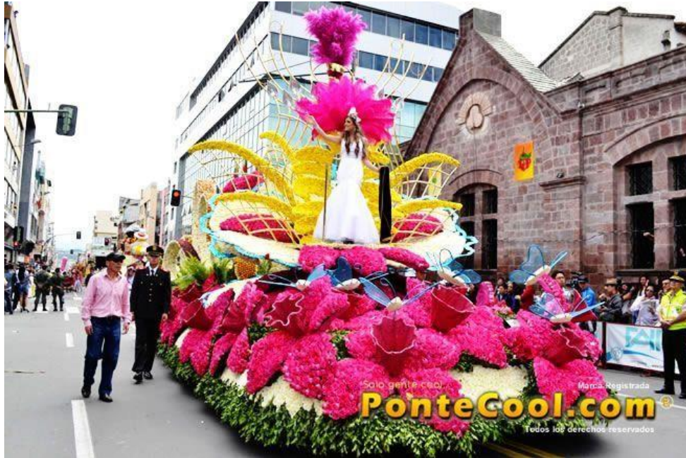
Figura 42. Enciende los colores de la alegría (2014)

terremoto de 1949 y renacer de los escombros”, que este desafortunado evento dejó en casi todas las familias de la ciudad pero como un elemento más de la naturaleza, el ser humano vuelve a florecer.