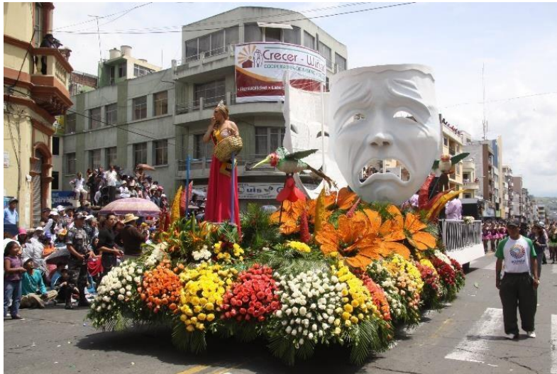
Figura 40. El dulce encanto de vivir (2011)

Todos estos elementos que van dando forma a la Fiesta de la Fruta y de las Flores (misas, bailes, desfiles, carros alegóricos, entre otros) realzan, sin duda, a esta hermosa ciudad llena de historia, cultura y tradición. La Figura 41 presenta un decorado gigante de dos campanas que está decorada con pan, frutas y flores. Un elemento que también es propio de esta fiesta se reconoce en las figuras que adornan la parte superior de las campanas y corresponden a calados eléctricos decorativos de uso común en la estética neo-vintage muy popular en estos días.