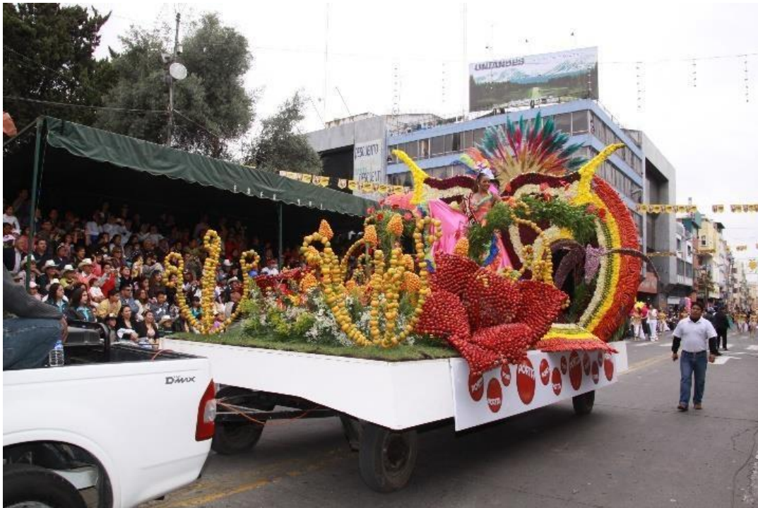
Figura 43. Néctar, Aroma y Color (2009)

La naturaleza representada por un paisaje bastante ecléctico conlleva un problema aparentemente de Asia, el oso-gato en peligro de extinción se ve reflejada el carro alegórico denominado familia de osos panda (Figura 44). Los osos panda representan la fragilidad y un problema ecológico, pero más allá de ello, la gestualidad antropomórfica muestra una ligera desolación con un árbol desprovisto de hojas en el que se han adherido arreglos flores algo dispersos y alejados de lo que podría ser un paisaje natural. La actitud antropomórfica de mamá oso y papá oso construida con felpa y crisantemos, representa el cuidado y cariño hacia un crío que no es suyo. El crío es un animal no bien identificado que, por otro lado, evoca la ausencia de descendencia, pero también guarda un significado de esperanza. La alegoría después de todo no sólo representa hechos pasados, sino también los futuros que se anhelan o no que no se anhelan.