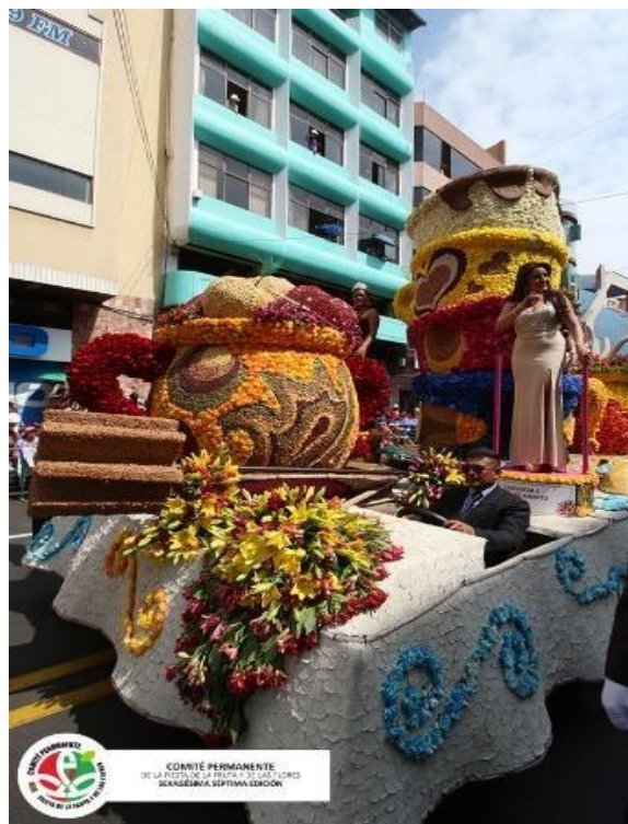
Figura 46. Crisol de sabiduría (2018)

En este caso, se simula algo más relista, pues una taza está ubicada sobre otra como si se hubiese ordenado una vez que se levanta la mesa después de un festín. Nótese que la taza superior tiene chocolate derramado en el lado menos inclinado. Otro elemento bastante peculiar es la decoración que se ha realizado en un tazón rebotante de frutas. Un elemento de cocina tradicionalmente empleado para hacer el chocolate es el molinillo este atraviesa y sobresale del carro alegórico adoptando el color de haber sido recientemente utilizado.