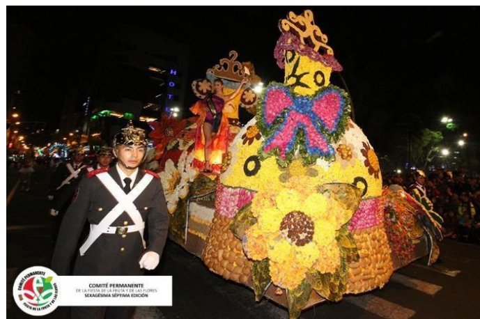
Figura 41. La alegría de la naturaleza (2020)

Todos estos elementos que van dando forma a la Fiesta de la Fruta y de las Flores (misas, bailes, desfiles, carros alegóricos, entre otros) realzan, sin duda, a esta hermosa ciudad llena de historia, cultura y tradición. La Figura 41 presenta un decorado gigante de dos campanas que está decorada con pan, frutas y flores. Un elemento que también es propio de esta fiesta se reconoce en las figuras que adornan la parte superior de las campanas y corresponden a calados eléctricos decorativos de uso común en la estética neo-vintage muy popular en estos días.