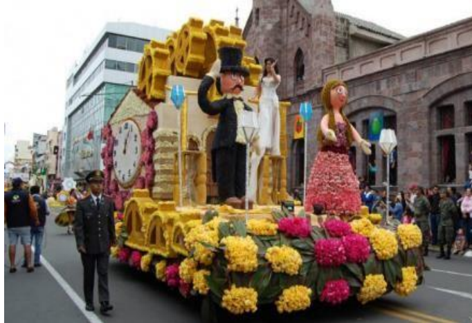
Figura 32. Recuerdos y añoranzas (2015)