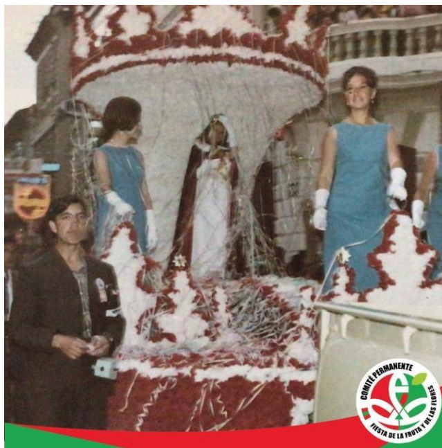
Figura 37. Reina De Ambato # 24

La fantasía es difícil representar, en todas las figuras míticas se advierten elementos propios de otras culturas que han trascendido hasta el espacio ambateño. Figuras mitológicas como un Pegaso, un cisne o el edén, muestran justamente la evocación de un pasado y el anhelo por la belleza y la bondad.