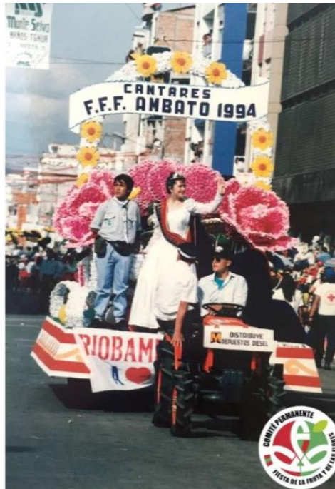
Figura 33. Cantares (1994)

disimulada dentro del tractor y no en el carro alegórico propiamente.