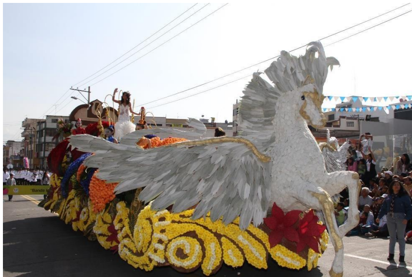
Figura 35. Ambato vive de corazón (2013)

de este gran carro alegórico (Figura 35). Sin embargo, el material de tela poliéster con el que está decorado no desentona al arreglo floral de rosas y crisantemos que constituye todo el resto de la plataforma. La reina que ocupa el lugar central, está adornada por adolescentes que están vestidas con trajes que a su vez están confeccionados con flores naturales tiene una singularidad que sugiere que la belleza más allá de lo terreno.