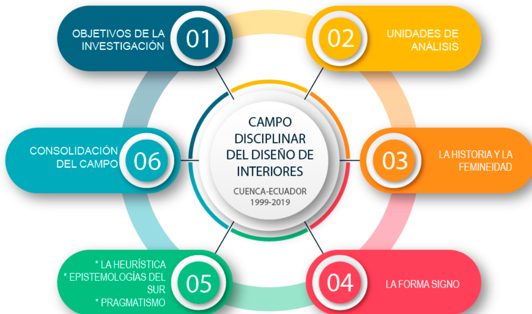
Figura 61. Variables de cierre y conclusiones de la investigación

91